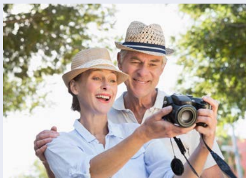
Unterwegs auf Entdeckungstour

„La Dolce Vita“ – schon Johann Wolfgang von Goethe wusste seit seiner Italienreise im Jahr 1786 die italienische Lebensart, das milde Klima und die Kunstschätze Roms zu schätzen. Entdecken Sie die „ewige Stadt“ und ihre 3.000-jährige Geschichte und lassen Sie sich von der Fülle an Sehenswürdigkeiten verzaubern: Petersdom, Vatikan mit Sixtinischer Kapelle, Forum Romanum, Kolosseum... Zudem erleben Sie Rom zu einer ganz besonderen Zeit! Nur alle 25 Jahre begeht Rom ein Jubeljahr das so genannte Heilige Jahr in der katholischen Kirche. Zentrale Elemente sind u.a. die Romwallfahrt sowie die Öffnung der Heiligen Pforte. Die Feierlichkeiten starten mit der Öffnung der Heiligen Pforte am Petersdom im Dezember 2024 und enden mit der Schließung derselben im Januar 2026 durch Papst Franziskus. Im zweiten Teil Ihrer Reise erkunden Sie die antike Stadt Pompeji, kosten von dem leckeren Limoncello, dem „Nationalgetränk“ der Region Kampanien, und entdecken die malerische Region rund um Sorrent. Außerdem erleben Sie die Schönheit der weltbekannten Sehnsuchtsinsel Capri am Golf von Neapel hautnah.