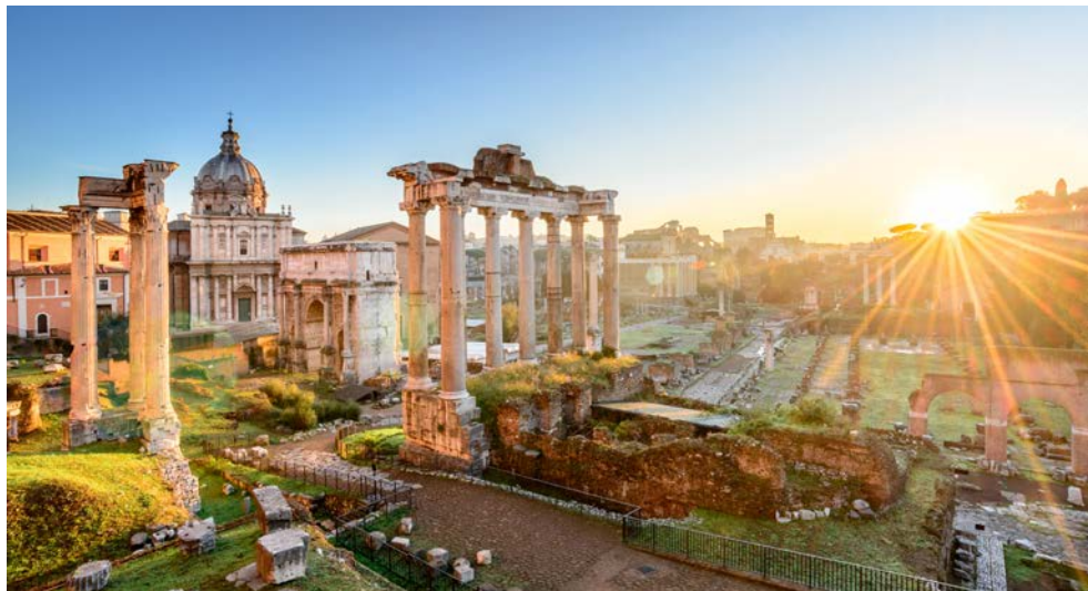
Forum Romanum in Rom

Am Vormittag lernen Sie die romantische Seite von Rom kennen. Auf der breiten „Spanischen Treppe“ an der Piazza di Spagna herrscht stets Hochbetrieb. Wer Rom wiedersehen will, wirft eine Münze in die Fontana di Trevi, einen kunstvollen Barockbrunnen von Nicolo Salvi aus dem 18. Jh. Auf der Piazza Colonna sehen Sie die herrliche Säule des Marc Aurel, auf der Piazza di Pietra die Ruinen des Hadriantempels. Schließlich gelangen Sie zum besterhaltenen Bauwerk des antiken Roms, dem Pantheon, dessen Grundstein aus dem Jahre 27 n. Chr. datiert. Noch heute gilt der Kuppelbau als Musterbeispiel alt-römischer Baukunst. Anschließend begeben Sie sich zur wunderschönen Piazza Navona mit der reich dekorierten Barockkirche Sant Agnese in Agone. Hier steht der berühmte Brunnen von Bernini „Fontana dei