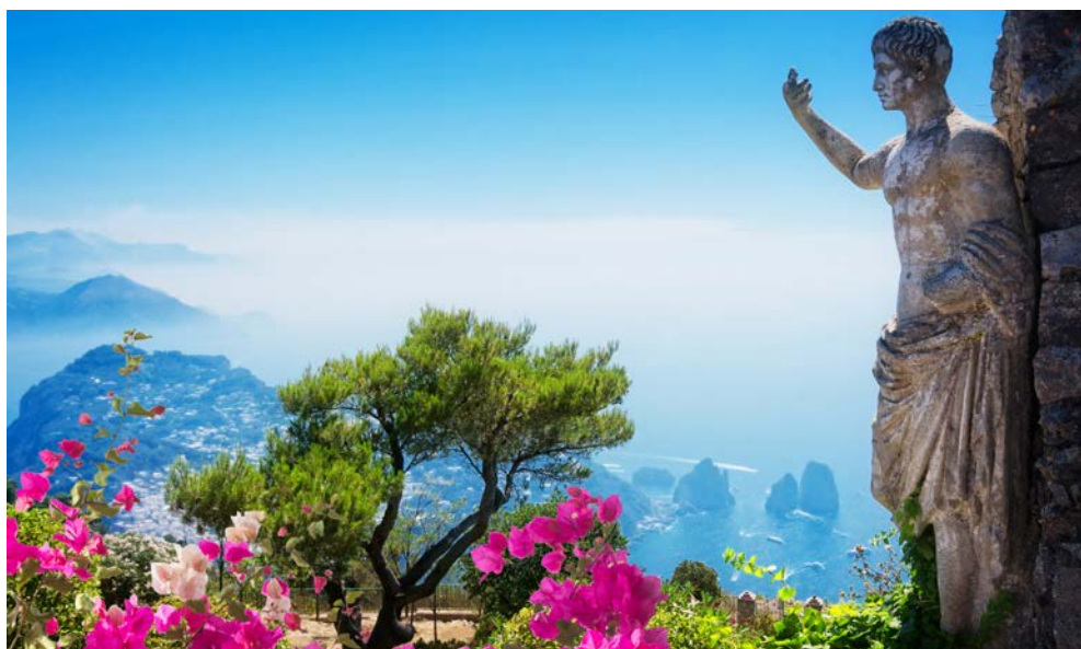
Zauberhafte Ausblicke auf Capri