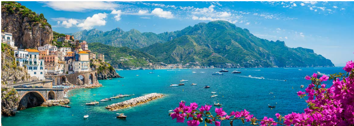
Ein traumhaftes Fleckchen Erde – die Region am Golf von Neapel