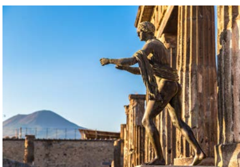
Die antike Stadt Pompeji, im Hintergrund der Vesuv

bewegte und lange Geschichte sowie die zahlreichen Sehenswürdigkeiten ziehen Touristen aus aller Welt an. Weiterfahrt zu Ihrem Hotel im Raum Halbinsel Sorrent.