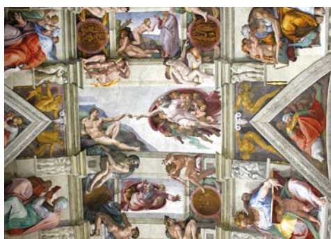
Sixtinische Kapelle – faszinierend

Der Vatikan, mit nur 0,44 km 2 der kleinste Staat der Welt, birgt Jahrhunderte alte Geschichte. Im Petersdom scheinen die unzähligen Figuren und Fresken ihre eigenen Geschichten zu erzählen und weisen auf so bedeutende Baumeister wie Bramante, Raffael und Michelangelo hin, die hier eines der wohl eindrucksvollsten Bauwerke der Welt geschaffen haben. Sie besuchen die Vatikanischen Museen und von dort aus gelangen Sie in die weltberühmte Sixtinische Kapelle. Im Rahmen des Rundgangs haben Sie die Gelegenheit die zwischen 1508 und 1512 meisterhaft gefertigten Fresken von Michelangelo zu bestaunen. Sie zeigen die biblische Schöpfungsgeschichte, darunter auch