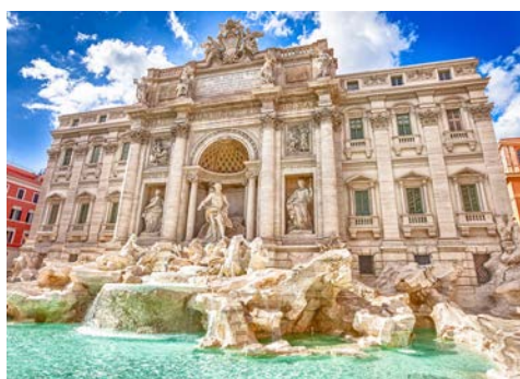
Der obligatorische Münzwurf am Trevibrunnen, ein Muss!

quattro Fiumi“, der die Flüsse Donau, Nil, Ganges und Rio de la Plata symbolisiert. Nutzen Sie den Nachmittag für einen entspannten Cappuccino in einem der zahlreichen Straßencafés oder lassen Sie sich durch das quirlige Rom treiben.