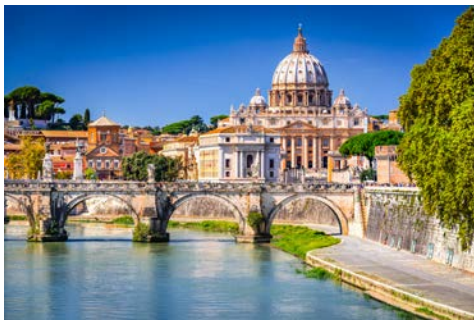
Die Engelsbrücke in Rom

(bestehend aus 7 x Abendessen, im Hotel bzw. Restaurant, exklusive Getränke)