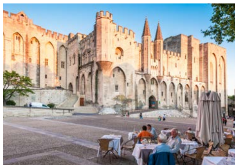
Papstpalast in Avignon

Nach dem Frühstück an Bord fahren Sie mit dem Bus von Tournon nach Valence, wo Ihr ca. 1,5-stündiger Stadtrundgang beginnt. Valence gilt als