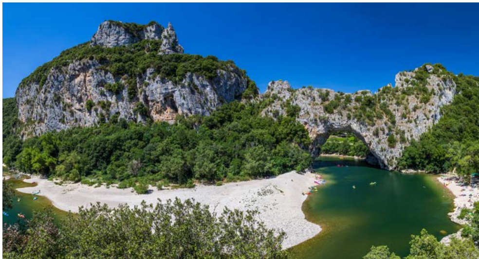
Grandiose Natur an der Ardèche

Die VIVA VOYAGE liegt heute über Nacht in Avignon. Nach dem Abendessen haben Sie daher Zeit, die Stadt bei Nacht auf eigene Faust zu erkunden und auf einem der romantischen Plätze ein Glas Wein oder ein Glas Pernod zu trinken.