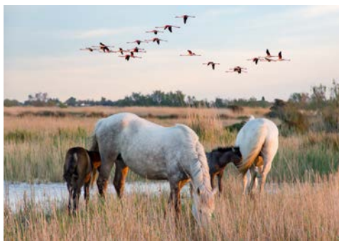
Zauberhaft – die Camargue

Ihr Schiff liegt heute direkt in Arles, welches Kaiser Konstantin einst als „Kleines Rom in Gallien“ bezeichnete. Nach dem Frühstück an Bord erwartet Sie um 09.00 Uhr ein geführter Rundgang durch Arles, bei dem Sie unter anderem das berühmte Amphitheater besichtigen. Noch heute zeugt das Theater