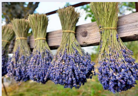
Der Duft von Lavendel wird Sie begleiten