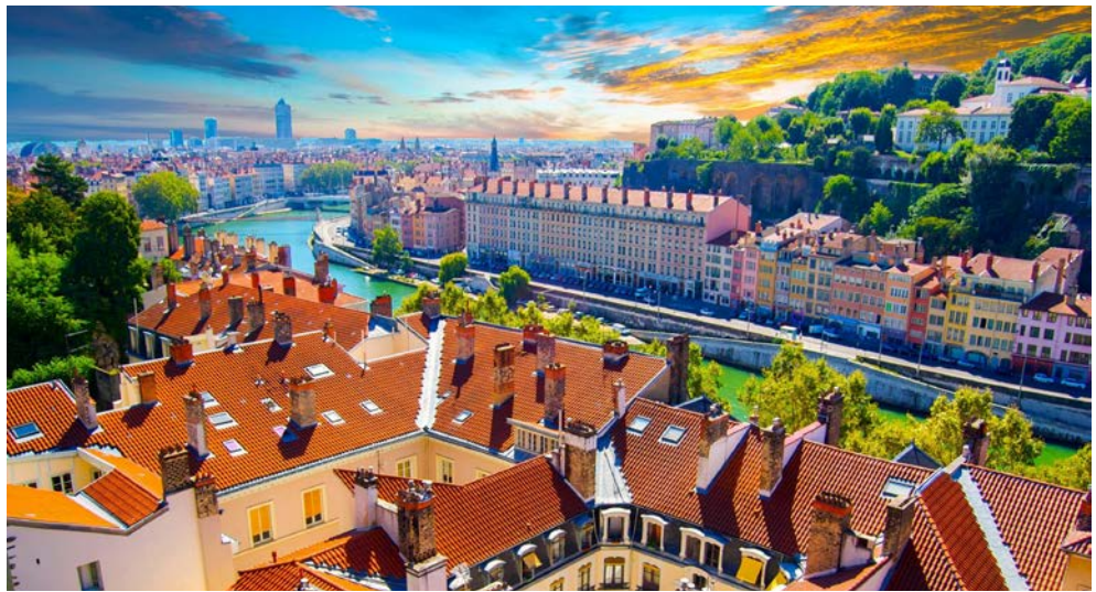
Blick über Lyon