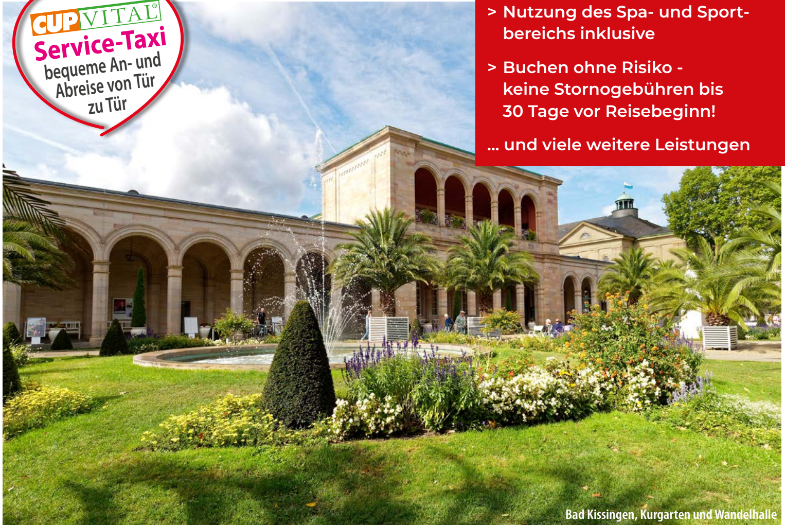
Bad Kissingen, Kurgarten und Wandelhalle