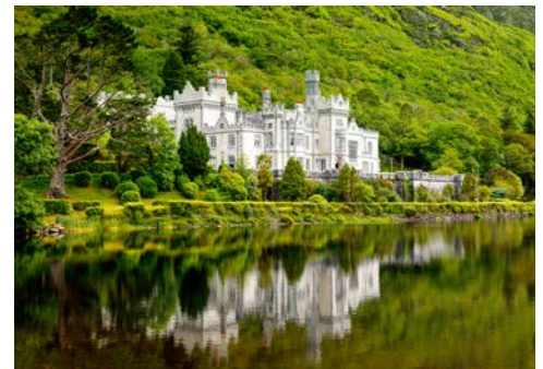
Kylemore Abbey in Connemara

Bevor die Reise Sie heute Richtung Westen führt, unternehmen Sie noch einen kurzen Stadtrundgang in Dublin. Dabei besuchen Sie die Sweny's Pharmacy, eine kleine ehemalige viktorianische Apotheke im Herzen des georgianischen Dublin, die vor allem durch das Buch Ulysses des irischen Nationaldichters James Joyce bekannt ist. Unterwegs besuchen Sie auch die 1213 erbaute anglikanische Saint Patrick's Kathedrale, auch die größte Kathedrale Irlands. Über die grünen Midlands fahren Sie an die Westküste