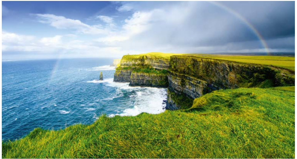
Cliffs of Moher

Was wäre eine Rundreise durch Irland ohne dessen Hauptstadt Dublin? Genau dort beginnt unsere Reise durch ein Land, das landschaftlich und kulturell so viel zu bieten hat wie kaum ein anderes! Erleben Sie Irlands einzigartigen „Wilden Westen“, wo die Natur ein bestechendes Panorama geschaffen hat. Entdecken Sie verwitterte Hochkreuze und alte Klosteranlagen aus frühchristlicher Zeit. Erfreuen Sie sich am satten Grün der Insel und am Anblick unzähliger blauer Seen. Traditionell gastfreundlich und aufgeschlossen sind die Bewohner Irlands. Wer einmal mit Iren in einem der „Singing Pubs“ zusammen saß, der weiß, dass dieses Volk zu feiern versteht.