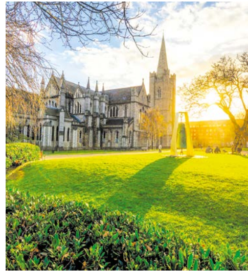
St. Patricks Cathedral in Dublin

Spaziergang hier ist ein besonderes Erlebnis. Erster Stopp ist das Burren Smokehouse, wo Sie in die Tradition der Lachs-Räucherkunst eingeführt werden – und den leckeren Lachs auch probieren können. Im Anschluss erreichen Sie die eindrucksvollen „Cliffs of Moher“, über 200 m senkrecht zum Atlantik abfallende Klippen. Weiterfahrt über Limerick nach Adare. Nach einem Rundgang durch dieses idyllische Dorf fahren Sie weiter zu Ihrem Hotel in der Region Kerry. 2 Nächte im River Island Hotel in der Region Kerry (Landeskategorie: 3 Sterne). Ca. 265 km