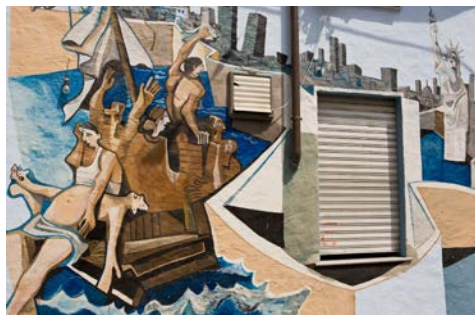
Die sogenannten „Murales“ in Orgosolo

Der heutige Tagesausflug führt Sie in das Kernland Sardinien. Morgens besuchen Sie zunächst das Trachtenmuseum in der Provinzhauptstadt Nuoro, mit der umfangreichsten Sammlung volkskundlicher Exponate Sardinien. Anschließend fahren Sie zum berühmten Gebirgsort Orgosolo, einst Heimat vieler