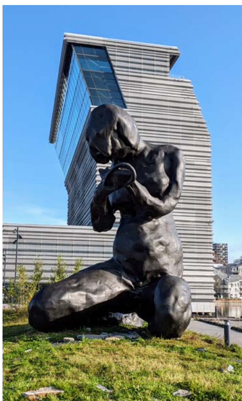
Skulptur vor dem Munch Museum

Gebäude im Stadtbild gut sichtbar und von allen Seiten erkennbar. Mit insgesamt 13 Stockwerken und 11 Galerien ermöglicht das MUNCH unterschiedliche Annäherungsweisen an Munchs Kunst und lässt seine Werke mit zeitgenössischer Kunst und anderen Werken von Vertreter*innen der Moderne in Dialog treten. Die festen Ausstellungen basieren auf der Werksammlung des MUNCH, die hier den Raum bekommt, den sie verdient. Der Abend steht Ihnen für eigene Erkundungen zur Verfügung.