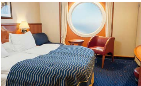
Kabinenbeispiel an Bord

Die Schiffe der COLOR LINE werden Sie begeistern. Die schwimmenden Hotels bieten Ihnen während Ihrer „Minikreuzfahrt“ eine Erlebniswelt der Extraklasse. Das Herz der faszinierenden Schiffe ist die 160 Meter lange Promenade mit Geschäften, Cafés und Restaurants. Besonders beliebt ist die Observation Lounge ganz oben auf Deck 15 – Bei einem Cocktail können Sie das Rundum-Panorama über die Ostsee oder den Oslo-Fjord genießen! Allabendlich heißt es „It's show time“ in der Show Lounge (Tischreservierung gegen Gebühr). Die Vielzahl an Bars bieten abwechslungsreiche Unterhaltung. Für sportlich Aktive stehen (teilweise gegen Gebühr) ein voll eingerichtetes Fitnesscenter, ein Wellnessbereich, ein Golf Simulator sowie das tropisch anmutende Aqualand zur Verfügung.