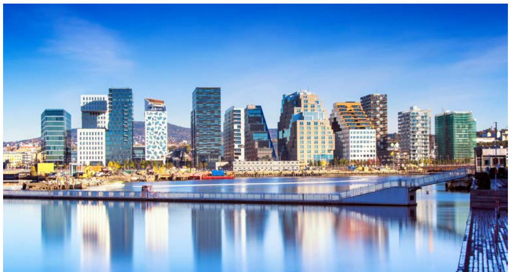
Das Hochhausviertel „Barcode“

Der heutige Tag steht ganz im Zeichen des berühmten Malers Edvard Munch. Das neue Museum ist 60 Meter hoch und mit recycelten, transparenten und perforierten Aluminiumplatten verkleidet. Mit dem charakteristischen Knick in der Spitze ist das