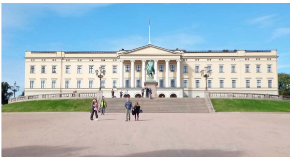
Königliches Schloss Oslo