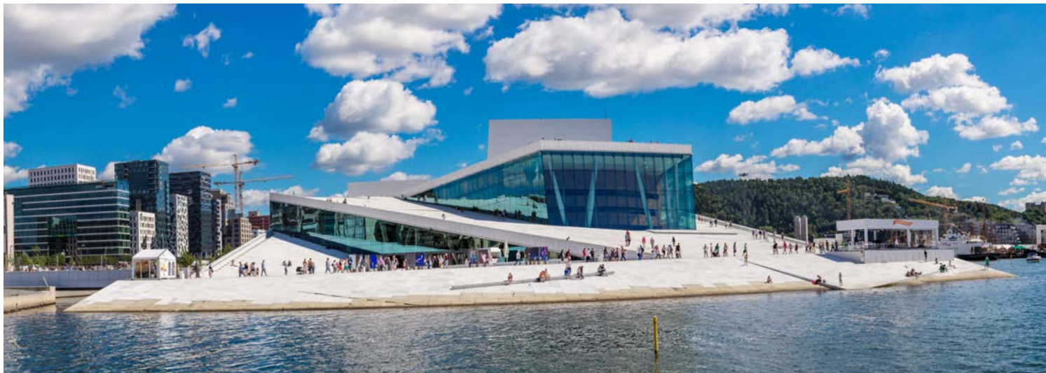
Das beeindruckende Opernhaus – neues Wahrzeichen von Oslo