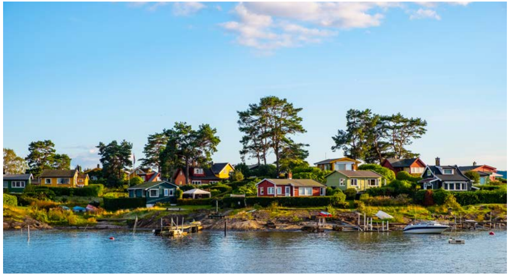
Ausblicke am Oslofjord