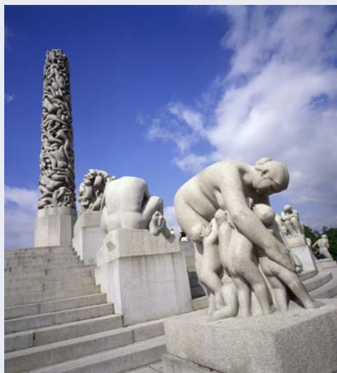
Der Vigeland Park