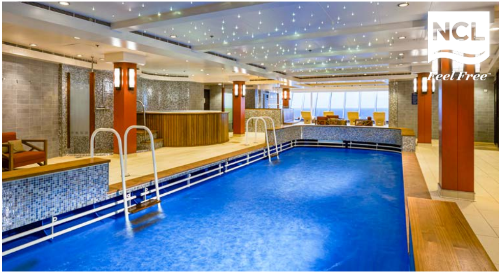
Das Manadra Spa® an Bord der NORWEGIAN DAWN