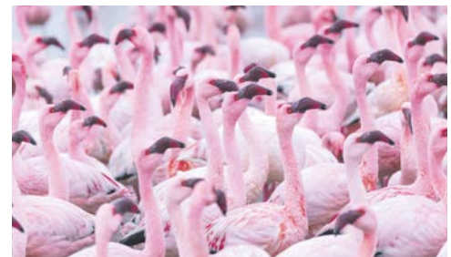
Jede Menge Flamingos in Walvis Bay

Programmänderungen vorbehalten. An- und Abreisetag dienen ausschließlich der Erbringung der vertraglichen Beförderungsleistungen. Je nach Fluggesellschaft und Flugdauer werden Bordverpflegung und Getränke nur gegen Bezahlung angeboten. Stand 06/23 – alle Angaben ohne Gewähr.