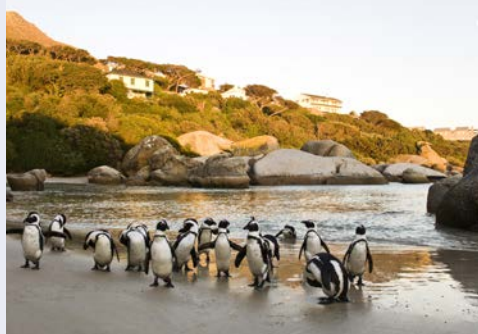
Pinguine in „Boulders Beach“