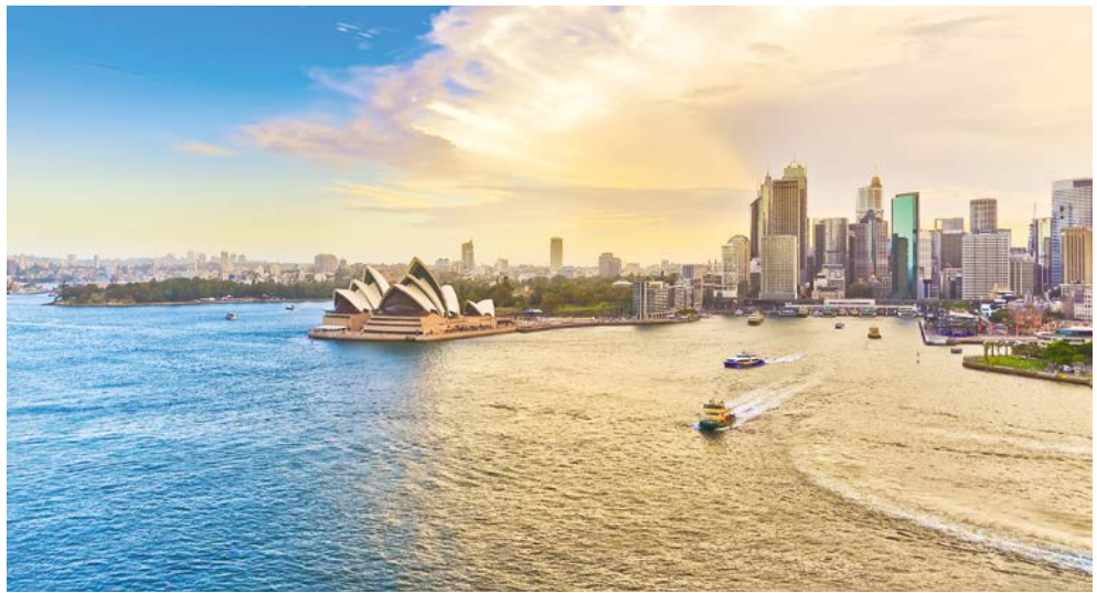
Blick auf Sydney