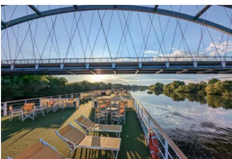
Gute Aussichten auf dem Sonnendeck

fränkische Fachwerkarchitektur prägt auch die Altstadt dieses Tors zum Spessart. Bauwerke wie das Kurmainzer Schloss unterstreichen den märchenhaften Charakter der Stadt.