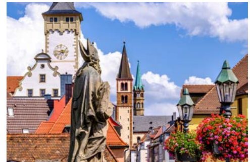
Altstadt-Impressionen in Würzburg

Kitzingen bzw. Marktbreit (je nach Liegeplatzbestätigung) heißt Ihr heutiges Ziel. Die historische Weinhandelsstadt Kitzingen ist Standort des Deutschen Fastnachtsmuseums, das Einblick in einen bedeutenden Teil fränkischen Brauchtums gibt. Als Wahrzeichen der Stadt gilt der Falterturm mit seiner schiefen Turmhaube. In Kitzingen trifft alte Bierbrauer- auf Winzertradition, wovon historische Kellieranlagen zeugen. Einige Wirtschaften Kitzingens bieten Gästen deftige fränkische Kost wie Sauerbraten mit Kloß oder „Karpfen Blau“. Alternativ haben Sie auch die Möglichkeit, bis Volkach an Bord zu bleiben und damit die Radtour um ca. 25 Kilometer zu verkürzen.