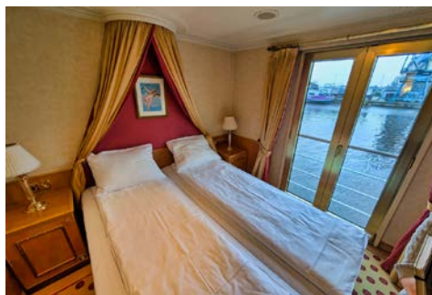
Kabinenbeispiel auf dem Oberdeck