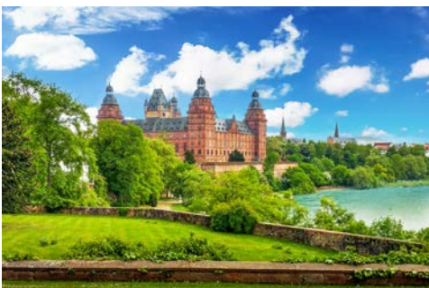
Blick auf Aschaffenburg

Das Highlight der heutigen Radtour ist Miltenberg mit ihrer 1200 erbauten Mildenburg. Von Erlenbach