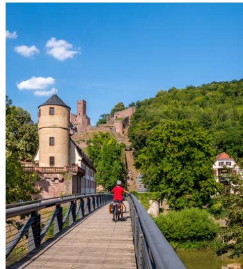
Auf dem Weg zur Burg Wertheim in Wertheim