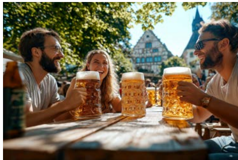
Gastlichkeit in einem Biergarten in Bamberg

In Bamberg werden Sie bereits von der CASANOVA zur Einschiffung (ab 16.00 Uhr) erwartet. Bamberg ist eine facettenreiche Stadt und zugleich UNESCO-Weltkulturerbe. Die „Inselstadt“ präsentiert sich als kleines Venedig, die „Bergstadt“ als fränkisches Rom und die „Gärtnerstadt“ als eigenes Unikat.