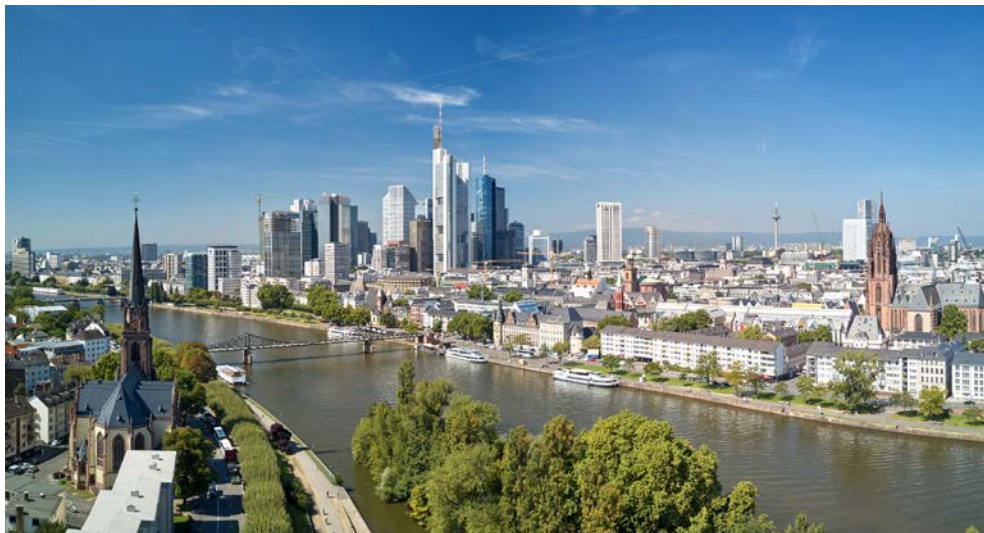
Skyline von Frankfurt