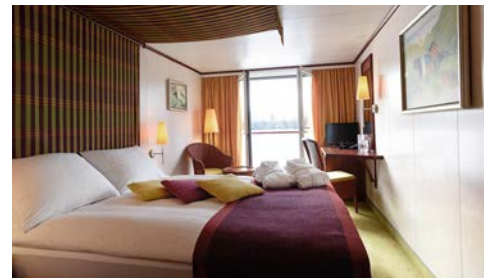
Kabinenbeispiel Kat. C mit frz. Balkon

Programmänderungen vorbehalten. An- und Abreisetage dienen ausschließlich der Erbringung der vertraglichen Beförderungsleistungen. Stand 01/24 – alle Angaben ohne Gewähr.