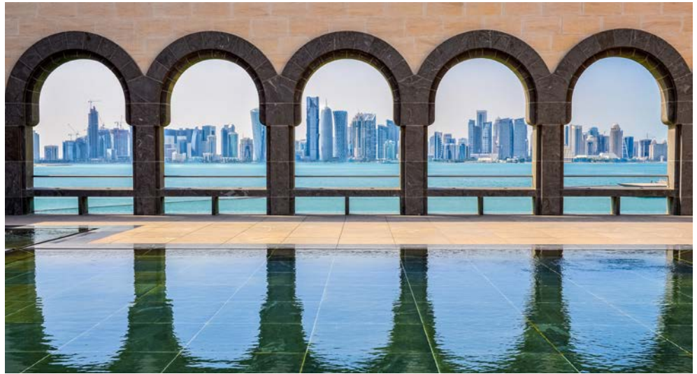
Doha – Tradition und Moderne