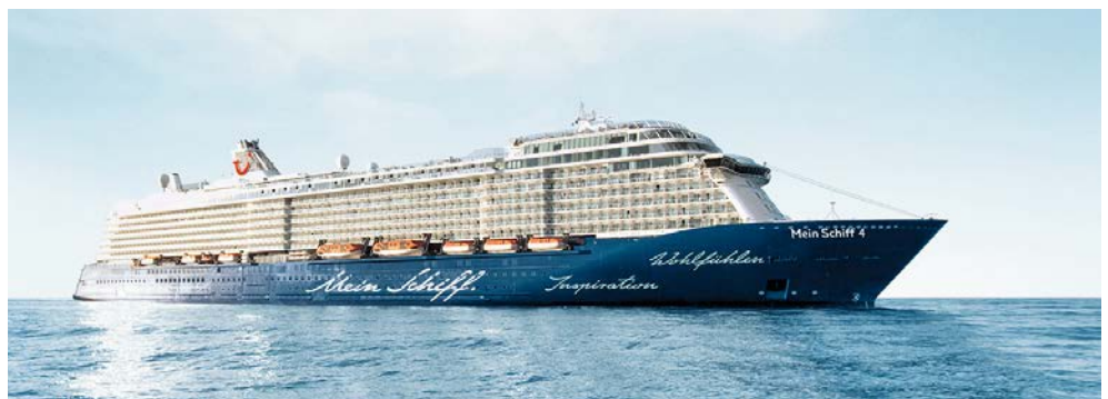
Willkommen auf der Mein Schiff 4

Vor wenigen Jahrzehnten waren hölzerne Fischerboote noch das übliche Fortbewegungsmittel der Region. Heute sind es Limousinen und Privatjets. Mit den Ölfunden in den 1960er-Jahren kam unermesslicher Reichtum nach Abu Dhabi und verwandelte es in eine futuristische Metropole. Schauen Sie sich um: