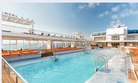
Pool an Bord