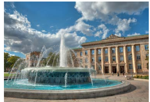
Paris? Wien? Rom? Nein, das ist Rouse

Nach den Erlebnissen der letzten Tage kommt ein entspannter Tag an Bord genau recht. Vor allem bei der Kulisse: Der wohl imposanteste Taldurchbruch in Europa ist die über 100 km lange Kataraktenstrecke mit dem noch berühmteren „Eisernen Tor“.