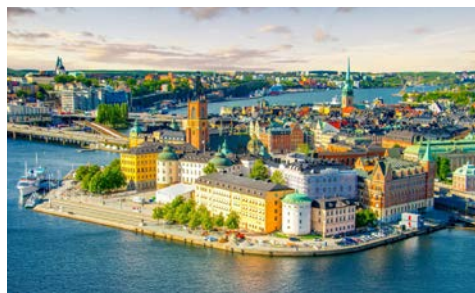
Blick auf Stockholm