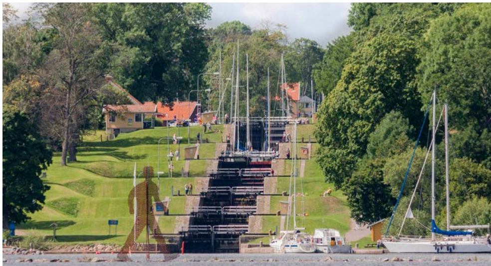
Die Schleusentreppen des Götakanals

Schwedens und wurde ungefähr um 1100 angelegt. Die Kirche gehört zu den interessantesten in Schweden und beherbergt zahlreiche mittelalterliche Kleinode. Heute wird sie als Pfarrkirche genutzt und kann daher nicht immer besichtigt werden. Wer keine Lust auf Kloster und Kirche hat, der kann auch ein schönes Bad im See Roxen nehmen. In Heda gehen die Ausflügler zurück an Bord und die DIANA passiert das erste Aquädukt der Reise. Sie erreichen das idyllische Kanaldorf Borensberg mit einer von Hand zu bedienenden Schleuse. Vielleicht erspüren Sie das renommierte Göta Hotell von 1908 auf Ihrem Weg zur Schleusentreppe in Borensult mit fünf zusammenhängenden Schleusen und einem gesamten Höhenunterschied von 15,3 m. Motala erlangte durch die 1822 hier angesiedelte Motala Werkstad den Ruf als „Wiege der schwedischen Industrie“. Hier befindet sich auch der Hauptsitz der Firma AB Göta Kanalbolag, die für den Betrieb und den Unterhalt des Kanals verantwortlich ist. Sie besuchen das Motala Motormuseum mit umfassender Sammlung von Autos, und Motorrädern in zeittypischen Szenarien, Radios, Spielzeug und allerlei Kuriositäten.