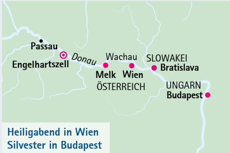
Heiligabend in Wien Silvester in Budapest

Einzelkabinen ab € 1.188,- (22.12.), ab € 2.431,- (27.12.) bzw. ab € 3.274,- (Kombi) auf Anfrage, begrenztes Kontingent. Es gelten die A-ROSA Premium alles inklusive Bedingungen. Die Sonderpreise gelten für ein limitiertes Kontingent. 1 mit Zusatzbett. 2 Ersparnis beim Kabinenpreis im Vergleich zum Katalogpreis.