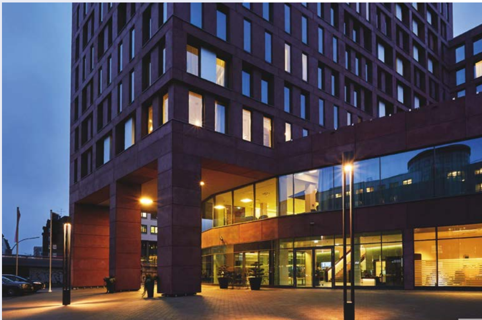
Ihr Hotel Hyperion Hamburg