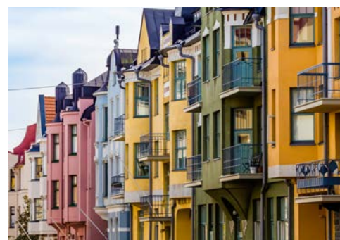
Eine der schönsten Straßen Helsinkis: die Huvilakatu