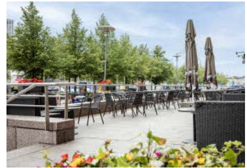
Die Terrasse Ihres Hotels