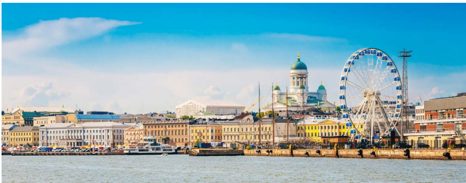
Helsinki – Stadt am Meer