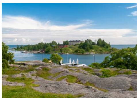
Blick vom Kaivopuisto-Park auf das Inselchen Harakka