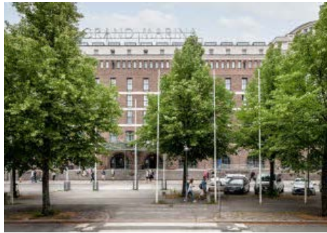
Ihr Hotel Scandic Grand Marina

Schiffsfahrt durch den Schärengarten von Helsinki nach Porvoo, geführter Stadtrundgang, Rückfahrt per Bus, Dauer ca. 8 Stunden, Mindestteilnehmerzahl: 15 Personen.