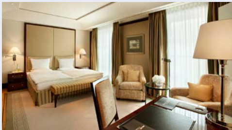
Zimmerbeispiel im Hotel Adlon Kempinski Berlin

Es ist eine der ersten Adressen in Berlin und Deutschland: das Hotel Adlon Kempinski Berlin direkt am Brandenburger Tor. Bedeutende Politiker, Künstler, Sportler und Wirtschaftsfunktionäre gehen hier ein und aus. Das Adlon Kempinski gehört zu den besten und bekanntesten Luxushotels der Welt. Lorenz Adlon, der berühmte Hotelier, erfüllte sich 1907 seinen Traum und baute am Brandenburger Tor „sein“ Hotel, das in den 20er Jahren Weltruhm erlangte. Während des Zweiten Weltkrieges als Lazarett genutzt, blieb es bis kurz vor Kriegsende nahezu unbeschädigt, ehe es aufgrund eines Brandes Anfang Mai 1945 größtenteils zerstört wurde. Zu DDR-Zeiten war im erhalten gebliebenen Flügel ein Hotel der DDR-Handelsorganisation HO untergebracht. Anfang der 70er-Jahre zog eine Lehrlingsschule in den Restbau ein. Endgültig abgerissen wurden die Ruinen 1984.