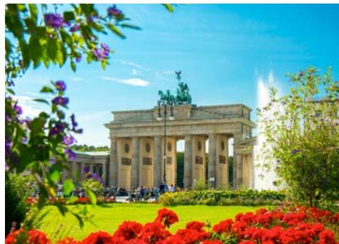
Direkt neben dem Adlon liegt das Brandenburger Tor

In Eigenregie reisen Sie nach Berlin zu Ihrem Hotel an: dem 5-Sterne Luxushotel Adlon Kempinski Berlin, die erste Adresse der Stadt, direkt am Pariser Platz. Um 14.00 Uhr beginnt das Reiseprogramm und ein Begrüßungssekt stimmt Sie auf diese exklusive Hauptstadtreise ein.