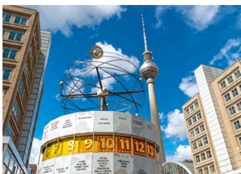
Weltzeituhr auf dem „Alex“