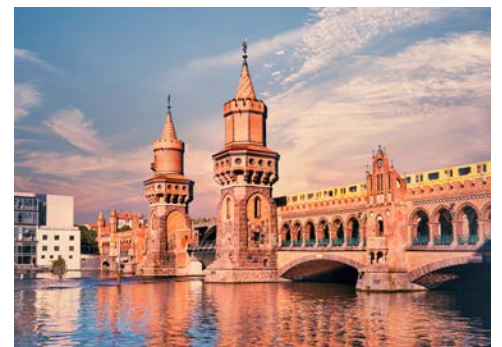
Die Oberbaumbrücke führt über die Spree

Nach dem Frühstück erfolgt die Heimreise in Eigenregie.