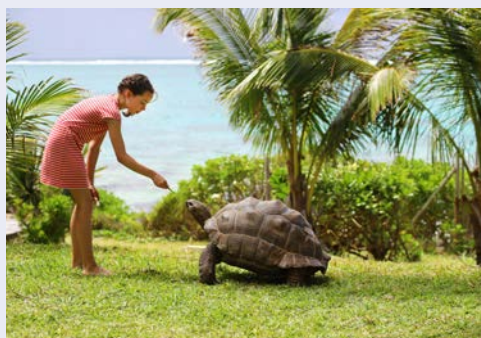
Vielleicht begegnen Sie einer Riesenschildkröte?