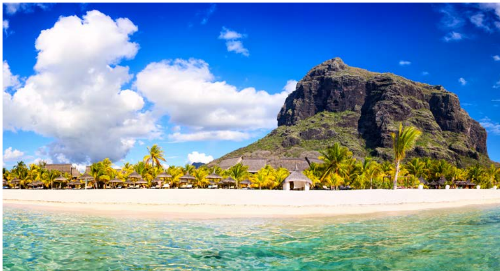
Spektakulärer Blick auf den Berg Le Morne Brabant