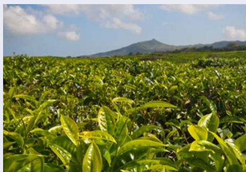
Teepflanzung auf Mauritius