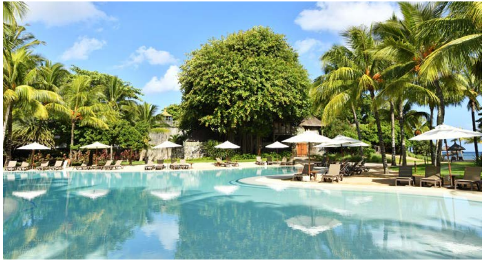
Einer der Pools Ihrer Hotelanlage

Mehr Beinfreiheit und Komfort? Fragen Sie nach unseren tagesaktuellen Business Class Tarifen.