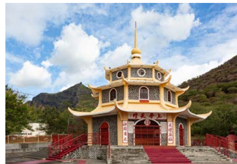
Tien Tan Pagode in Port Louis

Der tamilische Hindutempel ist der bedeutenden, hinduistischen Gottheit Shiva gewidmet, welche sowohl die Schöpfung als auch Zerstörung verkörpert. Nach einem geführten Rundgang besuchen Sie eine chinesische Pagode, die Bergkirche Marie Reine de la Paix ist ein weiterer imposanter Anblick, sie liegt seitlich des Signal Mountain. Spazieren Sie durch die alten Gassen und entdecken Sie die historischen Häuser und Gebäude aus der Kolonialzeit, die die Stadt so einzigartig und interessant machen. Bewundern Sie den farbenfrohen Obst- und Gemüsemarkt, der mit Düften orientalischer Gewürze Ihre Sinne erwecken wird. Hier testen Sie sich durch eine unglaubliche Auswahl an Streetfood.