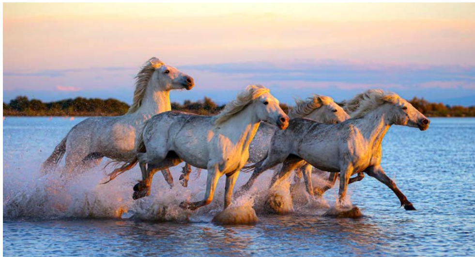
Wildpferde in der Camargue

Südfrankreich ist seit jeher ein Sehnsuchtsort für viele Reisende. Das Licht taucht die Landschaft in leuchtende Farben, die schon Picasso, Van Gogh und Henri Matisse inspirierte. Freuen Sie sich auf mediterranes Klima, köstliche Weine und eine fantastische Küche. Genießen Sie dies an Bord der A-ROSA STELLA mit all Ihren Sinnen. Das mittelalterlich-barock-moderne Lyon ist Start- und Endpunkt Ihrer Reise, von wo aus es nach den ersten Tagen auf der Saône weiter Richtung Süden in die malerische Provence geht. Avignon, Stadt der früheren Päpste, und Arles mit altrömischer Architektur werden Sie begeistern.