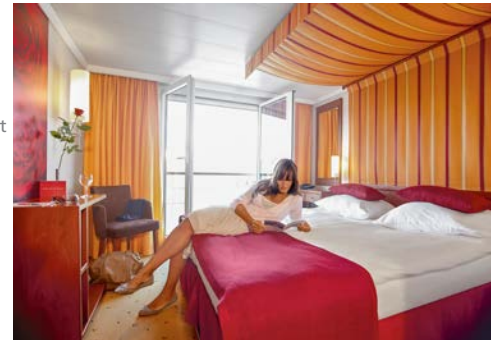
Kabinenbeispiel Kat. C/D