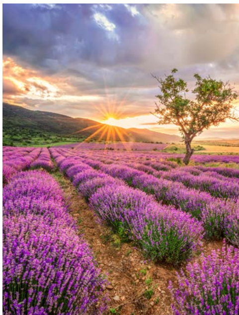
Der Duft der Provence