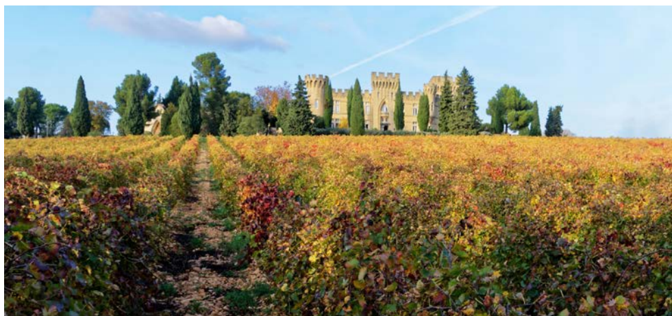
Weinregion Châteauneuf du Pape

Châteauneuf-du-Pape – bei diesem Namen klingt es bei jedem Weinkenner. Kein Wunder, ist er doch einer der bekanntesten Weinanbauorte der Welt. Selbstverständlich können alle Interessierten an einem buchbaren Ausflug zu den berühmten Weingütern teilnehmen. Die A-ROSA STELLA nimmt Kurs auf Avignon. „Sur le pont d'Avignon ...“ – wer kennt sie nicht, die uralte Brücke, die in einem Volkslied Weltruhm erlangte. Das nur noch in Teilen erhaltene Bauwerk zählt zum UNESCO-Weltkulturerbe. Da Sie über Nacht in Avignon verweilen, haben Sie genügend Zeit, um die Stadt kennenzulernen. Empfehlenswert ist zum Beispiel der Besuch der Markthallen. Selbst die Spitzenköche des Landes gehen hier einkaufen oder lassen sich von all der Frische für ihre nächste Kreation inspirieren.