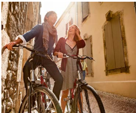
Wie wäre es mit einer Radtour?

Heute heißt es leider „Au revoir!“ – Sie gehen von Bord der A-ROSA STELLA. In Ihrem Koffer nehmen Sie die herrlichsten Eindrücke mit.