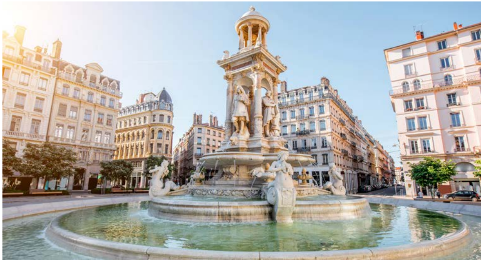
Die Altstadt von Lyon