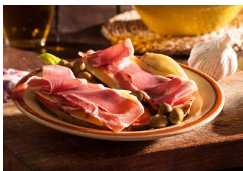
Einfach, pur und köstlich – „Pa amb Oli“

Bei diesem Ausflug haben Sie die Gelegenheit, das Mallorca der Mallorquiner abseits vom Tourismusboom kennenzulernen. Sie beginnen die Fahrt in Richtung Manacor und kommen nach Sineu, wo Sie am bunten Treiben eines typischen Bauernmarktes mit einer Vielfalt frischer Landesprodukte und lebenden Tieren teilhaben. Anschließend führt Sie der Weg durch die fruchtbaren Felder von Llubi und La Puebla bis nach C'an Picafort und Alcudia. Dann erwartet Sie das hübsche Fischer- und Hafenstädtchen "Puerto Pollensa". Nach einer Pause setzen Sie Ihre Fahrt fort bis nach Formentor. Die Halbinsel Formentor ist eine der landschaftlich eindrucksvollsten Punkte der Insel.