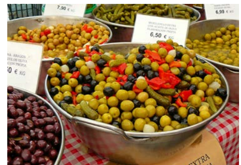
Willkommen auf dem Markt

Die eindrucksvolle Bergwelt der Westküste ist heute Ihr Ziel. Sie fahren in den Südwesten der Insel, über Andraitx und entlang der „Strecke der schönen Ausblicke“ erreichen Sie „Es Grau“ mit dem „Mirador de Ricardo Roca“ – ein auf einer Felsnase erbauter Aussichtsturm mit herrlichem Panorama. Sie sehen das malerisch gelegene Dörfchen Estellencs, das sich terrassenförmig am steilen Hang des Galatzó hinaufzieht. Weiter geht es durch Banyalbufar nach Valdemossa. Hier haben Sie die Möglichkeit, das bekannte Karthäuserkloster „La Cartuja“ zu besichtigen. Nach der Auflösung des Klosters im Jahre 1835 entstanden aus den ehemaligen Mönchszellen Privatwohnungen.