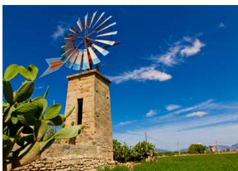
Windmühlen mit Tradition

Auf beiden Seiten der Landstraße ziehen hinreißende Landschaftsbilder mit Steilküsten, die teilweise über 200 m hoch sind, vorbei. An dem Aussichtspunkt "Es Colomer" haben Sie Gelegenheit, die überwältigende Aussicht zu bewundern. Über verschiedene Dörfer geht es danach zurück zum Hotel.