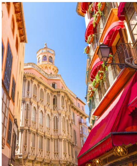
Palma de Mallorca, Altstadt