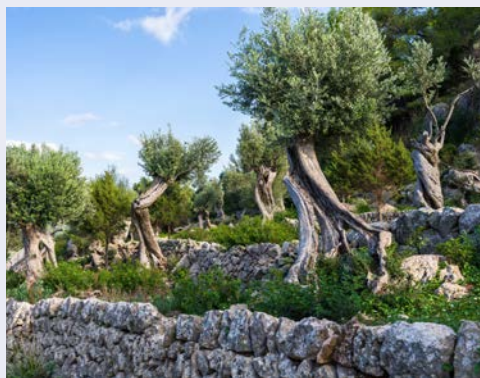
Olivenzweige – hier ohne Mohn

Lernen Sie die Kontraste der bezaubernden Inselmetropole kennen. Palma de Mallorca, die Hauptstadt der Balearen, zählt zu den schönsten Städten des Mittelmeeres. Mit ca. 425.000 Einwohnern lebt hier die Hälfte der Gesamtbevölkerung Mallorcas. Lassen Sie sich von der Lage der „La Ciutat“ (die Stadt) an einer der herrlichsten und, mit 20 km Länge, einer der großzügigsten Buchten des Mittelmeerraumes beeindrucken. Ein geführter Stadtrundgang durch die Altstadtgassen mit ihren sehenswerten, historischen Bauwerken und Innenhöfen, ein Besuch der berühmten Kathedrale und die anschließende