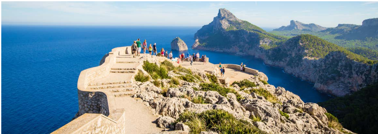
Blick zum Kap Formentor