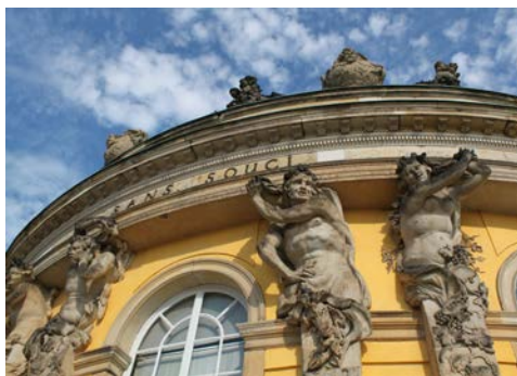
Schloss Sanssouci, Potsdam

Sehenswürdigkeiten der Stadt informiert. Zu den bedeutendsten Attraktionen zählen Schloss Sanssouci, das bekannteste der Hohenzollernschlösser, sowie der dazugehörige Schlosspark. Nach eigenen Skizzen ließ Friedrich II. dieses kleine Sommerschloss im Stil des Rokoko in den Jahren 1745 bis 1747 errichten. Die Schlösser- und Gartenarchitektur stehen seit 1990 als Welterbe unter dem Schutz der UNESCO. Ein weiterer Abstecher führt Sie nach Schloss Cecilienhof, dem letzten, im englischen Landhausstil entstandenen Schlossbau der Hohenzollern. Weltgeschichtlich relevant wurde Schloss Cecilienhof als Ort der Potsdamer Konferenz im Sommer 1945. Beide Schlossensembles werden von außen besichtigt. Mit dem Bus fahren Sie anschließend in die Altstadt Potsdams. Von Ihrem Reiseleiter bekommen Sie eine kleine Orientierungstour durch den historischen Kern der Stadt. Nach Erkundung des Holländischen Viertels mit seinen kleinen Geschäften und Cafés, bringt Sie der Bus zurück zum Hotel. Der Abend steht Ihnen zur freien Verfügung.