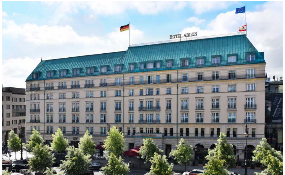
Legendär – das Hotel Adlon Kempinski Berlin