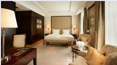
Zimmerbeispiel im Hotel Adlon Kempinski Berlin

Es ist eine der ersten Adressen in Berlin und Deutschland: das Hotel Adlon Kempinski Berlin direkt am Brandenburger Tor. Bedeutende Politiker, Künstler, Sportler und Wirtschaftsfunktionäre gehen hier ein und aus. Das Adlon Kempinski gehört zu den besten und bekanntesten Luxushotels der Welt. Lorenz Adlon, der berühmte Hotelier, erfüllte sich 1907 seinen Traum und baute am Brandenburger Tor „sein“ Hotel, das in den 20er Jahren Weltruhm erlangte. Während des Zweiten Weltkrieges als Lazarett genutzt, blieb es bis kurz vor Kriegsende nahezu unbeschädigt, ehe es aufgrund eines Brandes Anfang Mai 1945 größtenteils zerstört wurde. Zu DDR-Zeiten war im erhalten gebliebenen Flügel ein Hotel der DDR-Handelsorganisation HO untergebracht. Anfang der 70er-Jahre zog eine Lehrlingsschule in den Restbau ein. Endgültig abgerissen wurden die Ruinen 1984.