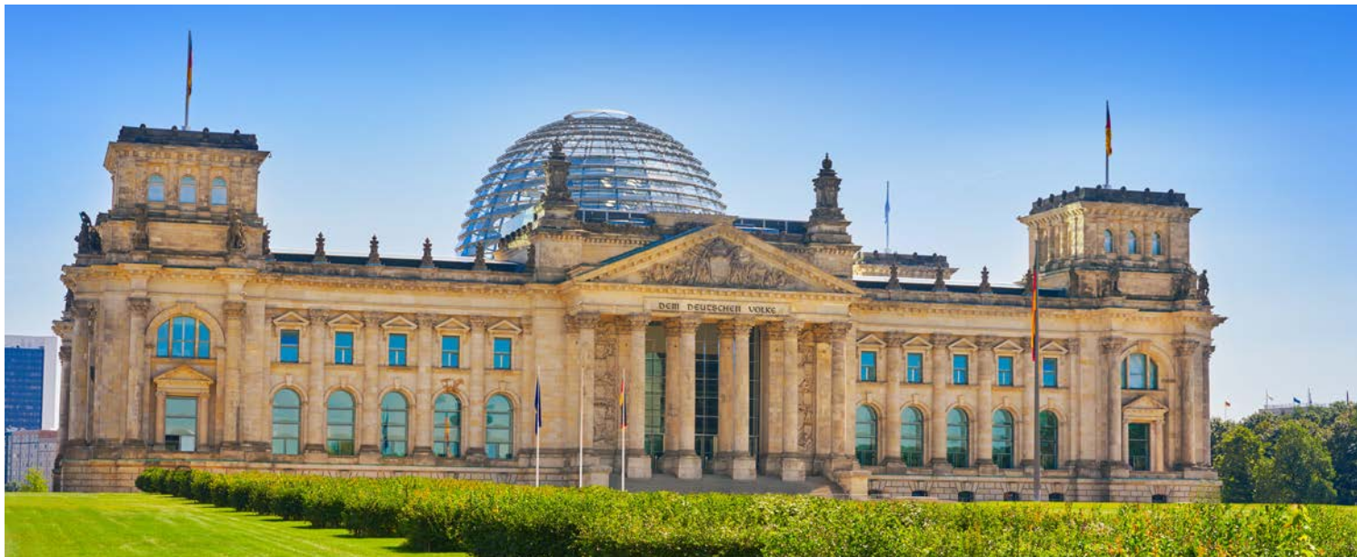
Nur einen „Katzensprung“ vom Adlon entfernt – der Reichstag

Bronzeskulptur der Siegesgöttin Viktoria auf der Siegessäule getauft haben. Vorbei am Schloss Bellevue und über die Spree, steigen Sie dann am Bundeskanzleramt aus und gehen über den Platz zum Reichstag, um von außen das Zentrum des politischen Wirkens zu betrachten, das gleichzeitig eines der architektonischen Meisterwerke der jüngeren Geschichte sein eigen nennt – die große gläserne Kuppel umrahmt vom klassizistischen Gebäudeensemble.