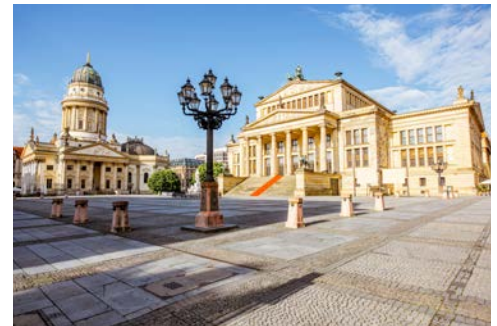
Der Gendarmenmarkt – der schönste Platz der Stadt

Berlin – nur wenige Städte haben eine Vergangenheit so geschichtsträchtig, wie die der deutschen Hauptstadt. Das historische Zentrum mit dem alten Prachtboulevard Unter den Linden lässt sich wunderbar zu Fuß erkunden. Ein professioneller Reiseleiter nimmt Sie mit auf eine spannende Route vorbei an Denkmälern, Wahrzeichen und moderner Architektur. Das Hotel Adlon befindet sich bereits mitten im historischen Stadtkern umgeben von der französischen, britischen und amerikanischen Botschaft, so dass die Tour direkt vom Hotel starten kann. Nach zirka zwei informativen und spannenden Stunden endet die Tour am Gendarmenmarkt. Danach steht der restliche Nachmittag zu Ihrer freien Verfügung. Für eine gemütliche Pause, haben Sie die Möglichkeit zu einer Einkehr im Rausch Schokoladenhaus. Genießen Sie eine Tasse heiße Schokolade, Tee oder Kaffee und ein Törtchen.