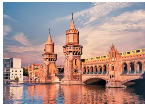
Die Oberbaumbrücke führt über die Spree

Nach dem Frühstück erfolgt die Heimreise in Eigenregie.