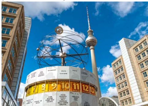
Weltzeituhr auf dem „Alex“

Wer mag, nimmt an einem zusätzlich buchbaren Ausflug nach Potsdam teil: Die kleine Stadt, die auch das Versailles des Nordens genannt wird, erreicht man von Berlin aus in einer knappen Stunde mit dem Bus. Begleitet von einem fachkundigen Reiseleiter werden Sie bereits auf dem Weg nach Potsdam über die geschichtlichen Hintergründe und die zahlreichen