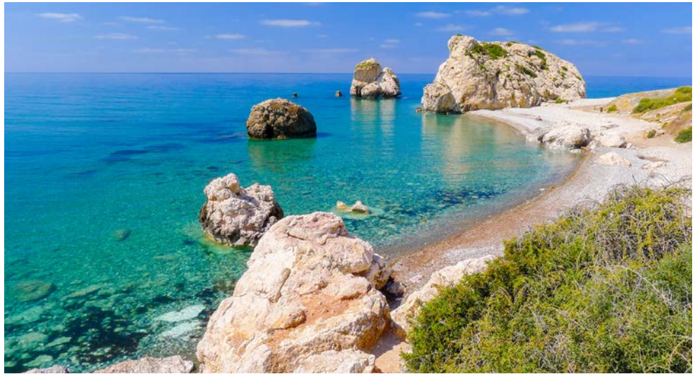
Felsen der Aphrodite

Hier machen die Götter Urlaub! Schon in der griechischen Mythologie wurde die paradisiische Mittelmeerinsel gepriesen. Zypern – das ist südländische Lebensart und eine Sagenwelt voller Mythen und Legenden. Die spannende Historie dieser Insel, die seit 1974 in den türkisch besetzten Teil und die Republik Zypern geteilt ist, lässt sich auf dieser Reise nachvollziehen. Ob antike Zeugnisse der römischen Besatzung, mystische Klöster, die eindrucksvollen Bäder der Aphrodite, lokale Weinanbauregionen, die im türkisch besetzten Teil liegende Stadt Famagusta oder die pulsierende Hauptstadt Nikosia – auf dieser Reise lernen Sie nicht nur die Vielfalt der zypriotischen Kultur kennen, sondern auch und vor allem das Leben und die Menschen auf dieser einzigartigen Insel.