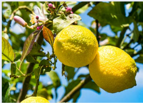
Willkommen auf Zypern