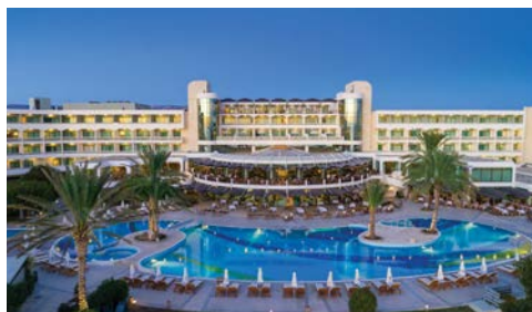
Hotel Athena Beach

Das Athena Beach Hotel in Paphos besticht durch seine zentrale Lage zu den wichtigsten Sehenswürdigkeiten. Die Anlage verfügt über 3 Süßwasserpools, sowie Innen- und Außen Jacuzzis und ein hauseigener Elixir Spa-Bereich mit Sauna. Entspannen Sie im beheizten Pool oder genießen Sie ein Abendessen in gemütlicher Atmosphäre im hauseigenen Restaurant. Jedes der klimatisierten Gästezimmer verfügt über einen Balkon, Minibar, Föhn und Safe.