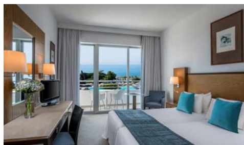
Beispiel – Zimmer mit Meerblick