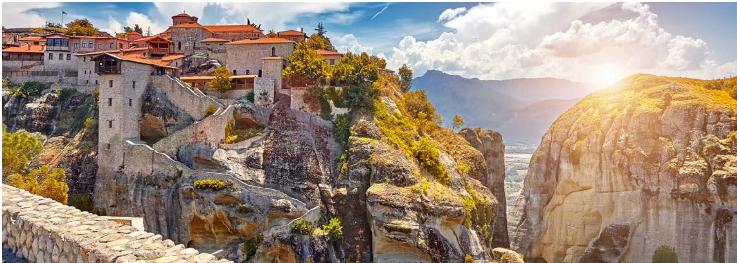
Beeindruckend – Meteora-Klöster