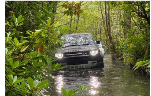
Off-Road durch das Gelände

Sie genießen als Mitfahrer das Passagiererlebnis in einem z.B. Morgan Plus Four Manual. Begleitet wird die Fahrt entweder von einem erfahrenen Guide als Beifahrer oder Fahrer. Den Tag lassen Sie bei einem gemeinsamen Abendessen ausklingen.