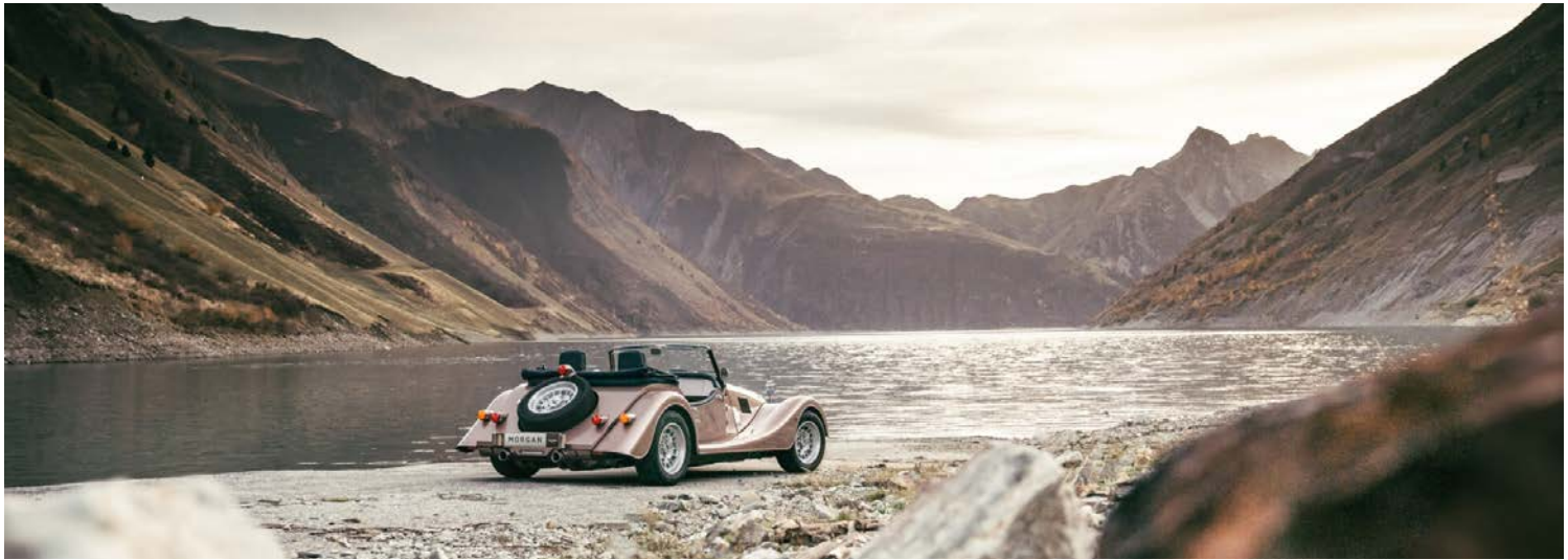
Der Morgan Plus Four Manual