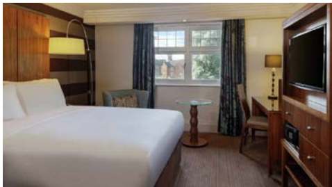
Zimmerbeispiel Hotel Hilton

Erleben Sie eine unvergessliche Zeit im Dunston Hall Hotel Spa & Golf Resort (Landeskategorie: 4 Sterne) in Norwich, einem Landsitz im elisabethanischen Stil aus dem Jahr 1859. Erkunden Sie die Waldlandschaft, genießen Sie ein wohlthuendes Bad und eine Sauna oder besuchen Sie das Lilac Room Spa and Salon, um sich verwöhnen zu lassen.