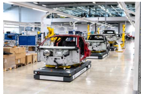
Einblick in die Lotus-Fertigung