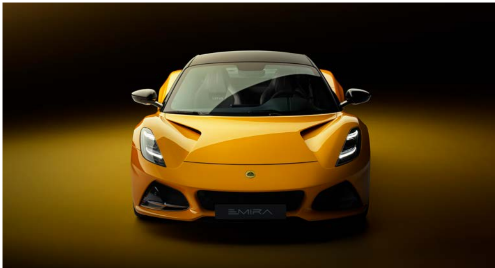
Der Lotus Emira

jedes Motorrad von Triumph auszeichnet. Sehen Sie wie vom ersten Konzept über die Konstruktion bis hin zur Realisierung die meistverkauften Modelle von Triumph entstehen. Nach einem gemeinsamen Mittagsimbiss im Triumph-Cafe fahren Sie in die Grafschaft Norwich, wo Sie für eine Nacht Ihr Hotel beziehen. Ein gemeinsames Abendessen beschließt den Tag.