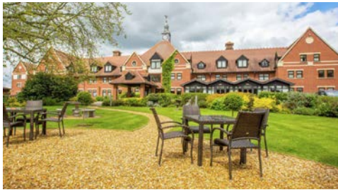
Das Hotel Hilton

Das Hotel Hilton (Landeskategorie: 4 Sterne) in Stratford-upon-Avon liegt zentral zu Shakespeares Sehenswürdigkeiten in Stratford-upon-Avon, nur 10 Gehminuten vom Royal Shakespeare Theatre entfernt. Entspannen Sie sich im Garten und stöbern Sie in den weniger als 1,6 km entfernten Geschäften im Stadtzentrum. Jeder Aufenthalt beginnt mit unserem charakteristischen warmen Schokoladenkeks.