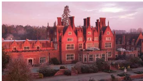
Das Dunston Hall Hotel

Erleben Sie eine unvergessliche Zeit im Dunston Hall Hotel Spa & Golf Resort (Landeskategorie: 4 Sterne) in Norwich, einem Landsitz im elisabethanischen Stil aus dem Jahr 1859. Erkunden Sie die Waldlandschaft, genießen Sie ein wohlthuendes Bad und eine Sauna oder besuchen Sie das Lilac Room Spa and Salon, um sich verwöhnen zu lassen.