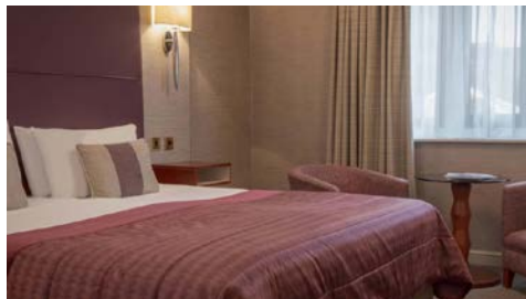
Zimmerbeispiel Dunston Hall Hotel