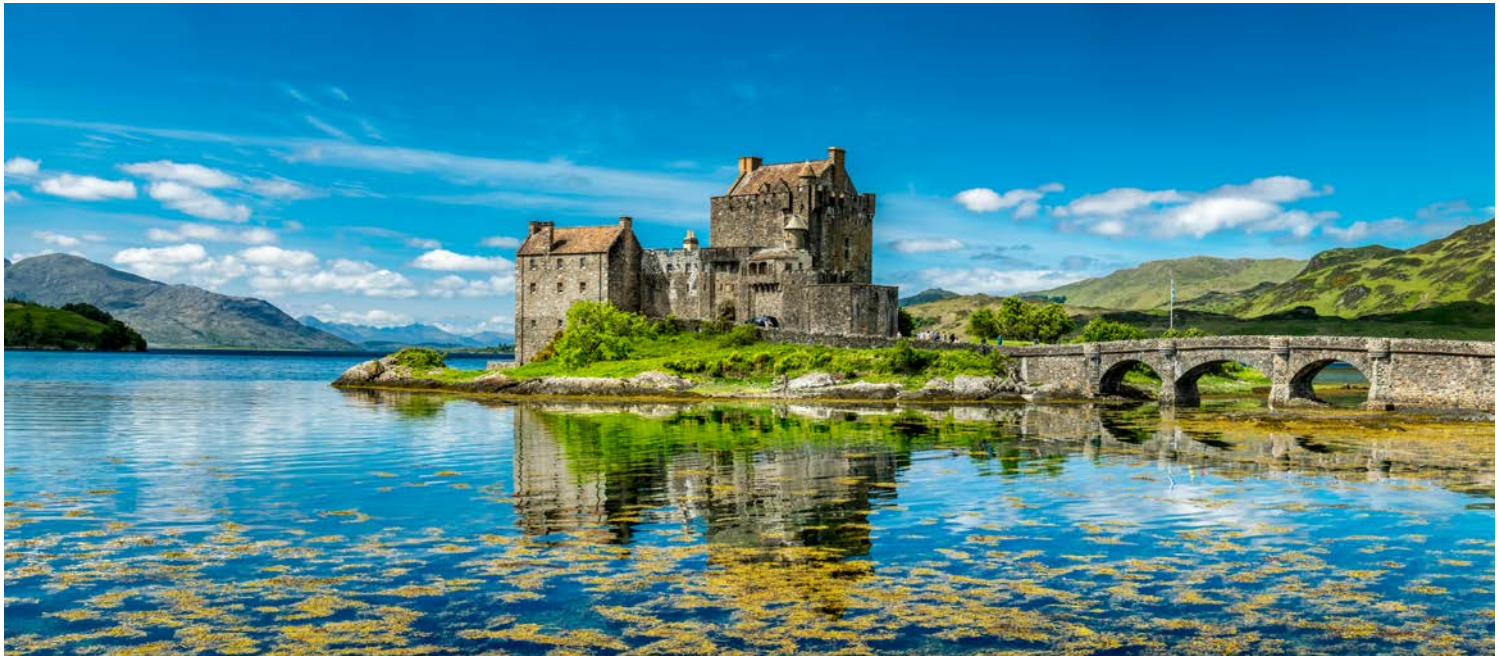
Eilean Donan Castle