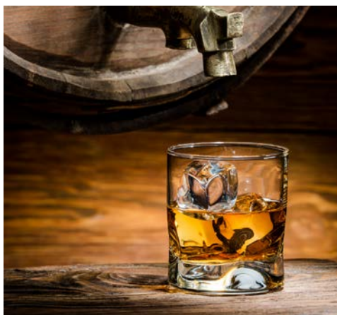
Wie wäre es mit einer Whisky Verkostung?

Vulkanfelsen gelegene Burg. Zu sehen gibt es hier die schottischen Kronjuwelen und den „Stone of Destiny“, den schottischen Krönungsstein, der erst seit kurzem wieder hier ist, wo er hingehört. Sie können außerdem die Privatgemächer Maria Stuarts besichtigen, sowie das älteste Gebäude Edinburghs, die St. Margaret's Chapel aus dem 11. Jh. Am Nachmittag können Sie Edinburgh auf eigene Faust erkunden. Besuchen Sie eines der Museen im Stadtzentrum oder bummeln Sie durch die modisch-eleganten Geschäfte der Princes Street oder durch die traditionellen Geschäfte der Royal Mile. Ca. 15 km (F, A)