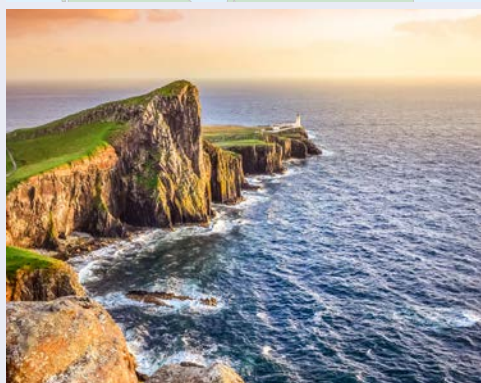
Willkommen in Schottland