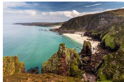
Küste in der Region Wester Ross

Heute endet Ihre Reise mit dem Transfer zum Flughafen Edinburgh (ca. 20 km) und dem Rückflug nach Deutschland. (F)