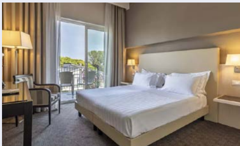
Zimmerbeispiel im Hotel Villarosa

Ihr Hotel in Desenzano del Garda: Das Hotel Villarosa (Landeskategorie: 4 Sterne) in zentraler Lage am Gardasee wurde im neoklassischen Stil errichtet. Die eleganten und geräumigen Zimmer, alle mit Balkon, sind geschmackvoll eingerichtet und mit allem ausgestattet, was Sie für einen komfortablen Aufenthalt benötigen (Internetanschluss, Klimaanlage, TV, Minibar, Safe, Wasserkocher für Tee und Kaffee, Bademantel und Hausschuhe, Kingsize-Bett oder zwei Einzelbetten. Das Badezimmer verfügt über Badewanne, Dusche und Haartrockner. Im hoteleigenen Restaurant haben Sie die Möglichkeit, köstliche Gourmetküche mit modernem Flair zu entdecken, darunter Fisch- und Fleischspezialitäten, bei denen die Gerichte durch sorgfältige Präsentation in wahre Meisterwerke verwandelt werden. Die Gartenanlage bietet eine schöne Atmosphäre, auch zum Spazierengehen.