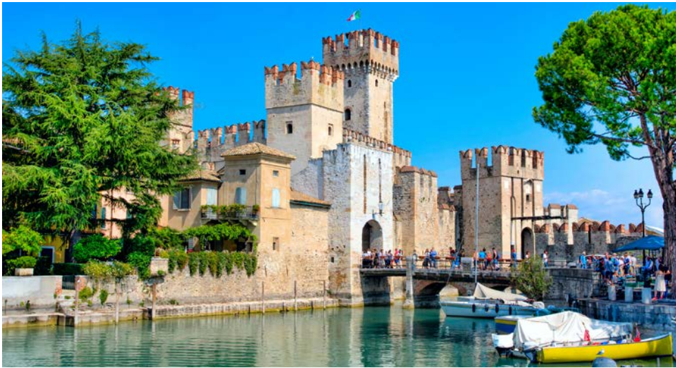
Sirmione mit Blick auf die Scaligerburg