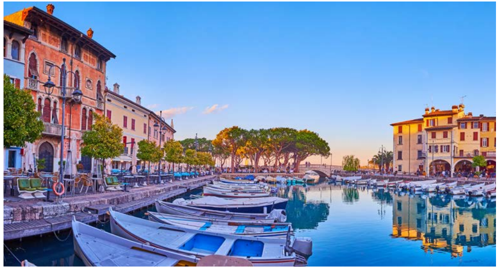
Willkommen in Desenzano