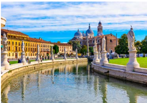
Padua, Prato della Valle

Padua liegt in der Region Venetien auf der Strecke zwischen Verona und Venedig und gehört als Kulturstadt zu den ältesten Städten Italiens. Viel des ursprünglichen Charmes konnte erhalten werden, so dass ein Gang durch das historische Zentrum einer kleinen Zeitreise gleicht – und das völlig Wetter-unabhängig, da rund 23 km Arkadengänge durch die wunderschöne Altstadt führen. Insgesamt liegen die kulturhistorisch wertvollen Sehenswürdigkeiten in fußläufiger Entfernung zueinander. Berühmt ist