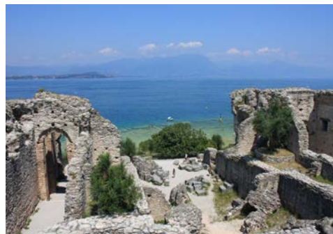
Grotten des Catull

natürlich die Universität von Padua. Gegründet 1222, ist sie eine der ältesten Universitäten Europas. Einer ihrer bekanntesten Lehrkräfte war Galileo Galilei, der in der Entstehung des naturwissenschaftlichen Denkens und in der Geschichte der Universität Padua einen entscheidenden Platz einnimmt. Das ehemalige Machtzentrum der Adelsfamilien in Piazza dei Signori, das religiöse Zentrum in Piazza Duomo sowie das Handelszentrum mit den Markthallen in Piazza delle Erbe und Piazza della Frutta sind ebenfalls in der Rangliste bedeutender Bauten ganz weit oben. Die bekannteste Sehenswürdigkeit von Padua befindet sich jedoch in der kleinen privaten Kapelle der ehemals sehr reichen Familie Scrovegni. Es sind die Freskenmalereien des Malers Giotto, der innerhalb von 2 Jahren (von 1303 bis 1305) die Bibelgeschichte eindrucksvoll in der Kapelle darstellte, die ihr den Beinamen „Sixtinische Kapelle von Padova“ verliehen. Freuen Sie sich auf eine Besichtigung während Ihres geführten Rundgangs. Vielleicht haben Sie anschließend Zeit, im berühmten Café Pedrocchi einzukehren. Seit 1831 eines der prächtigsten Cafés, die je gebaut wurden und einst Treffpunkt für Intellektuelle, Künstler, Aristokraten und Bürgerliche.