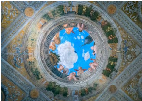
Mantua, Camera degli sposi

der „Camera degli Sposi“ – dem Hochzeitszimmer – und mit dem Studierzimmer der Isabella d'Este ist ein besonders schönes Beispiel. Doch auch der mittelalterliche Palazzo della Ragione mit dem Uhrturm, das Stadtmuseum im Palazzo San Sebastiano, die Rotonda di San Lorenzo oder die Basilika Sant'Andrea lohnen einen Besuch. Freuen Sie sich auf einen geführten Stadtrundgang mit Besichtigung des Herzogpalastes. Anschließend haben Sie noch etwas freie Zeit vor Ort.