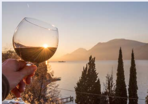
Genuss auf ganzer Linie!