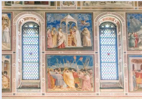
Fresken in der Scrovegni-Kapelle in Padua