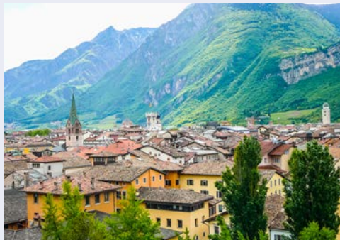
Blick auf Trento

Freuen Sie sich auf diese besondere Kulturreise unter der fachkundigen Führung der Gartenexpertin und ausgewiesenen Italienkennerin Gabriele Böhm und der durchgehenden Begleitung eines komfortablen Reisebusses.