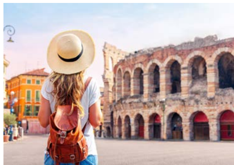
Die Arena von Verona

Weiterfahrt nach Trento, Hauptstadt der Autonomen Provinz Trient und Trentino-Südtirol. Die Stadt liegt, umgeben von Bergen, im Etschtal direkt an der Etsch, 55 km südlich von Bozen und 100 km nördlich von Verona. Hier treffen alpines Flair und mediterrane Leichtigkeit aufeinander. Nutzen Sie die freie Zeit für ein Mittagessen, bevor Sie einen ca. 2-stündigen Altstadttrudgang mit Dombesichtigung unternehmen. Sie entdecken eine mit Fresken geschmückte Renaissancestadt, die auf antiken römischen Siedlungen errichtet wurde. Im 16. Jahrhundert fand hier das Konzil von Trient statt und noch heute zeugen prächtige Paläste von der einstigen Macht der Stadt. Anschließend Weiterfahrt an den Gardasee nach Desenzano zu Ihrem Domizil für die nächsten Tage. Gemeinsames Abendessen im Hotel.