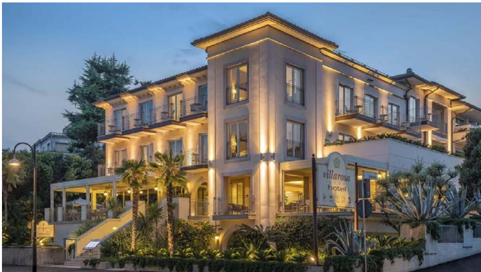
Ihr Hotel Villarosa