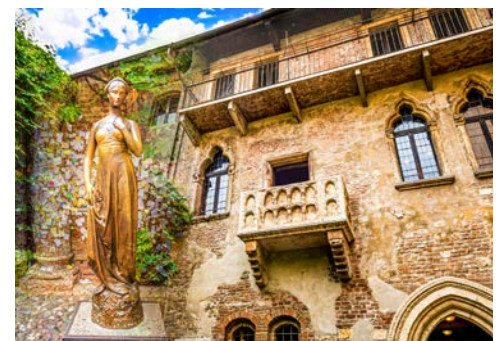
Haus der Julia mit dem berühmten Balkon

Chr. offiziell gegründet. Bereits um 30 n. Chr. wurde das gut erhaltene und in das heutige Stadtbild mit einbezogene Amphitheater erbaut – heute Zentrum der alljährlichen berühmten Opernfestspiele. Andere Baudenkmäler aus dem Altertum sind z.B. die ehemaligen römischen Stadttore Porta Borsari und Porta Leoni aus dem 1. Jh. vor Chr.. Die Ponte Scaligerowurde zwar wieder neu aufgebaut, stammt ursprünglich jedoch aus den Jahren 1355/1357. Historische Fassaden aus verschiedenen Jahrhunderten umgeben die Piazza delle Erbe, Marktplatz und Versammlungsort der mittelalterlichen Stadtrepublik. Und so könnte man fortfahren – kein Wunder, dass die Altstadt von Verona zum UNESCO-Welterbe gehört. Und was ist mit den Geschichten? In Verona finden Sie das Haus der Julia (Casa di Giulietta) mit dem berühmtesten Balkon der Literaturgeschichte. Obwohl der Balkon in den 1930er Jahren nachträglich angebaut wurde ist er zu einer regelrechten Pilgerstätte geworden.