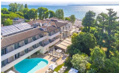
Hotelanlage Hotel Villarosa