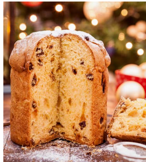
Zu Weihnachten Tradition zum Dessert: Panettone

seinen 3.300 Plätzen jahrelang zu den größten und angesehensten Opernhäusern der Welt gehörte zur weitläufigen Piazza del Plebiscito. Im 19. Jahrhundert wurde sie für Aufmärsche und Feste genutzt, heute ist sie beliebte Flaniermeile. An deren Ende befindet sich der Palazzo Reale – der Königspalast aus dem 17. Jahrhundert. Danach werfen Sie noch einen Blick in die wunderschöne Einkaufspassage Galleria Umberto I. Sie wurde in den Jahren 1887–1890 erbaut und ist von einer großen Glaskuppel überdacht. In ihrem Inneren finden sich zahlreiche Mosaik- und Ornamente. Abschließend darf das berühmteste Gericht der Stadt nicht fehlen. Ende 2017 wurde die neapolitanische Pizza von der UNESCO zum Weltkulturerbe erklärt – Neapel gilt als Wiege der Pizza. Danach erfolgen die Fahrt zum Flughafen und der Rückflug zum gebuchten Flughafen.