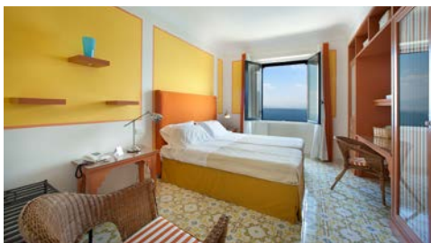
Zimmerbeispiel – Standard mit Meerblick