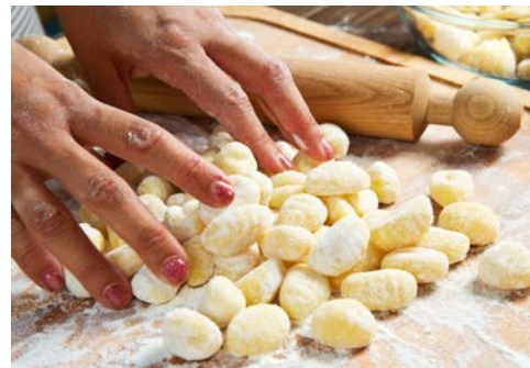
Freuen Sie sich auf frisch zubereitete Gnocchi

Der Tag steht zur freien Verfügung. Spazieren Sie z. B. durch das weihnachtlich geschmückte Sorrent, nehmen Sie an der heiligen Messe im Dom teil oder genießen Sie einfach nur den Tag im Hotel. Gemeinsames Weihnachtsabendessen im Hotel. Der erste Weihnachtsfeiertag ist in Italien der wichtigste – an diesem Tag feiert das ganze Land die Geburt des Jesuskindes (il Bambinello Gesu) und der Papst erteilt allen Gläubigen der Welt aus dem Vatikan den Segen „urbi et orbi“. Bereits am Morgen erfolgt die Bescherung mit den Geschenken für die Kinder, die hierzu gerne unter den heimischen Tannenbaum gelegt werden. Danach wird innerhalb der Familie ausgiebig gegessen.