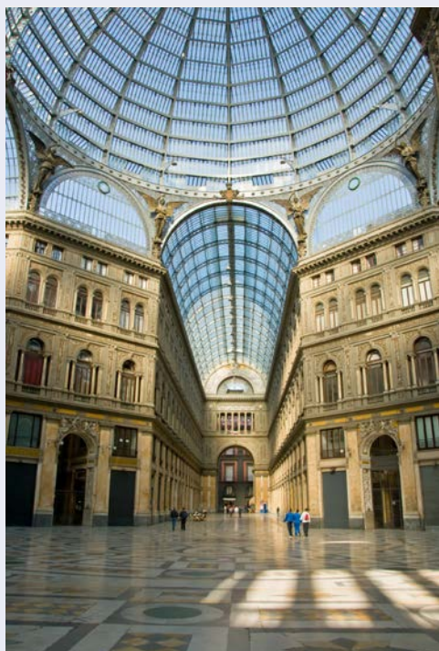
Passage Galleria Umberto I in Neapel

Das traditionsreiche Hotel Minerva aus dem Jahr 1878 öffnet seine Pforten über die Festtage! Der Ausblick von der Terrasse auf den Golf von Neapel und den Vesuv ist Balsam für unsere Seele in diesen turbulenten Zeiten!