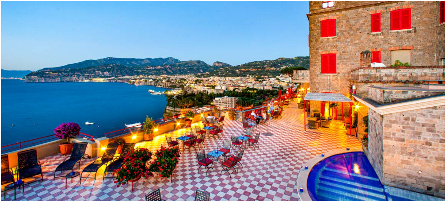
Das Hotel Minerva