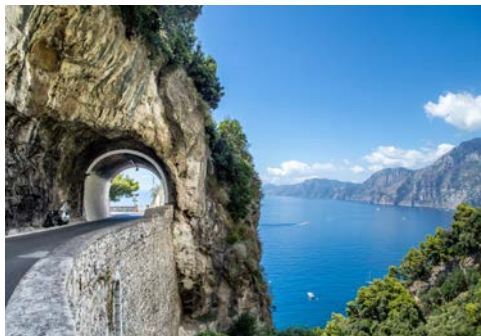
Spektakuläre Straßenführung an der „Amalfitana“

Den Schönheiten der seit 1997 zum UNESCO-Weltkulturerbe gehörenden Amalfiküste gebührt heute Ihre ganze Aufmerksamkeit. Entlang der kurvenreichen Küstenstraße geht es vorbei an Positano und Amalfi, einer der ältesten Seerepubliken Italiens und Namensgeberin der Region bis nach Minori. Von dort aus geht über die Sorrentinische Halbinsel zurück zu Ihrem Hotel in Sorrent. Der Rest des Tages steht zur freien Verfügung. Gemeinsames Abendessen im Hotel.