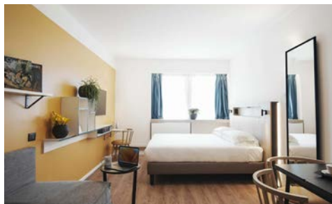
Zimmerbeispiel - Aparthotel

Das Aparthotel Colombo (Landeskategorie: 4-Sterne) ist die ideale Wahl für Reisende, die eine moderne und komfortable Unterkunft nahe dem Zentrum der ewigen Stadt suchen. Im Stadtteil Ostiense gelegen ist es der ideale Ausgangspunkt für Ihre Erkundungen der Stadt. Erst kürzlich komplett renoviert empfängt Sie das Hotel mit modern eingerichteten Zimmern jeglichen Komforts.