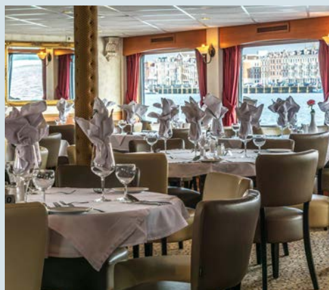
Restaurant an Bord