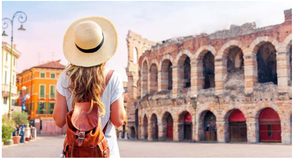
Willkommen in Verona

Eine beinahe schon mediterrane Landschaft, entspannte Spaziergänge an Seepromenaden, durch Arkaden und üppige Parks, einmalige kulturelle Schätze: Es gibt viele Gründe für eine Reise an den Lago di Garda. Der Gardasee übt eine gewaltige Faszination aus. Südlich der Alpen verlieren die atlantischen Tiefausläufer ihre Wirkung und man taucht ein in ein mediterranes Klima. Mit den schneebedeckten Hochalpen im Hintergrund öffnet sich eine subtropische Park- und Gartenlandschaft. Schon früh im Jahr blühen Christrosen, Jasmin, Magnolien, Kamelien und Oleander. Hinzu kommt der Reiz einer gewachsenen Kulturlandschaft mit alten Städten und Dörfern