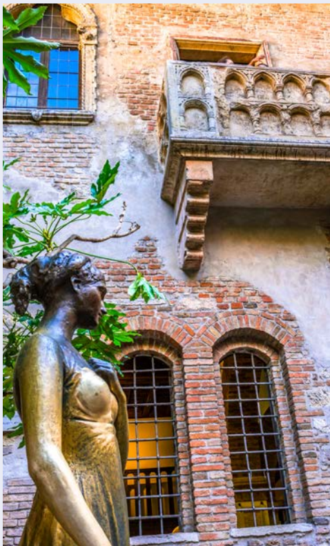
Romeo und Julias Balkon in Verona