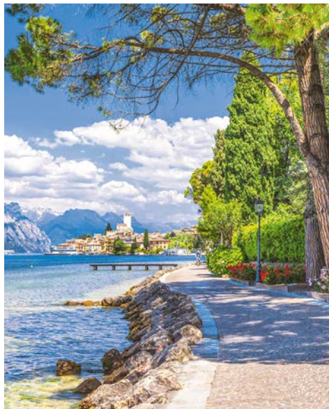
Malcesine am Gardasee

Lohnenswert ist auf jeden Fall ein Ausflug in die Stadt Romeo und Julias, nach Verona. Aber nicht nur die tragischste Liebesgeschichte der Weltliteratur hat hier stattgefunden, sondern jeden Sommer finden hier im römischen Amphitheater die weltberühmten