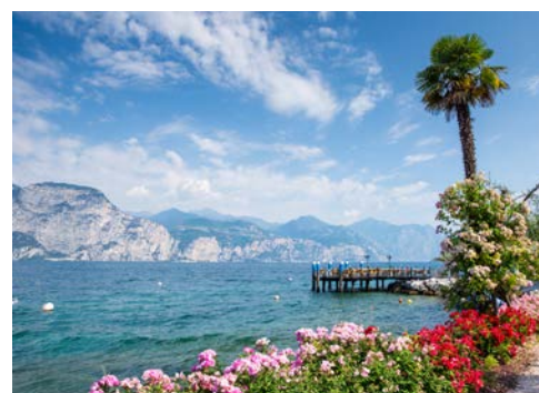
Wunderschön der Gardasee

Heute endet Ihre schöne Reise. Es erfolgen der Transfer zum Flughafen in Verona und die Rückreise.