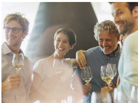
Wie wäre es mit einer Weinprobe?

Opernfestspiele statt und in der stimmungsvollen Altstadt öffnen sich weite Plätze, die von prachtvollen Renaissance-Palästen, romanischen und gotischen Kirchen und von vielen anderen Zeugnissen vergangener Epochen gesäumt. Schliesslich kann man hier aber auch hervorragend einkaufen. Den Rückweg zum See sollten Sie durch das Valpolicellagebiet antreten. Hier erwartet Sie eine kleine Weinprobe des örtlichen Weins.