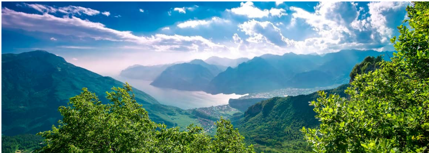
Blick auf den Gardasee

Opernfestspiele statt und in der stimmungsvollen Altstadt öffnen sich weite Plätze, die von prachtvollen Renaissance-Palästen, romanischen und gotischen Kirchen und von vielen anderen Zeugnissen vergangener Epochen gesäumt. Schliesslich kann man hier aber auch hervorragend einkaufen. Den Rückweg zum See sollten Sie durch das Valpolicellagebiet antreten. Hier erwartet Sie eine kleine Weinprobe des örtlichen Weins.