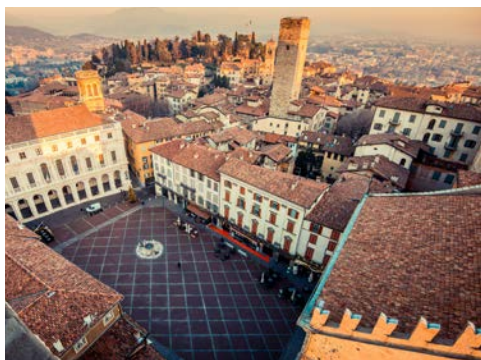
Piazza Vecchia in Bergamo