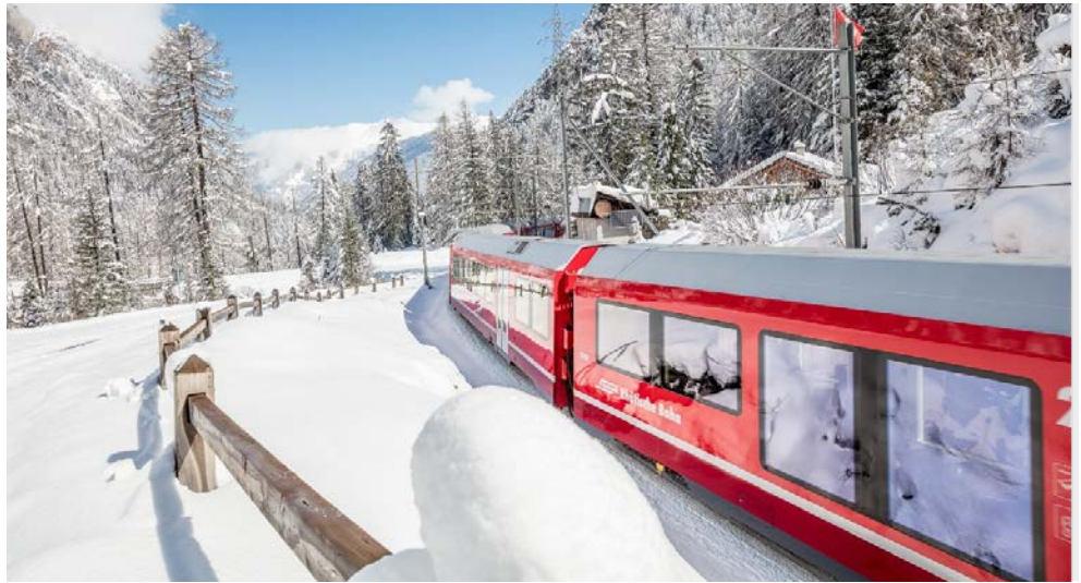
Der Bernina-Express fährt durch verschneite Landschaften

Seien Sie mit dabei, wenn Sie mit dem weltberühmten Bernina-Express auf den höchsten Bahngleisen Europas und den steilsten der Welt an spektakulären Kunstbauten wie dem Landwasserviadukt, hinauf zum ewigen Eis der Gletscher und wieder hinab ins italienische Tirano fahren. Genießen Sie südländisches Flair bei einem Spaziergang durch die Gassen von Como und einen fantastischen Blick aus 715 m Höhe auf den Comer See. Lernen Sie das Palmenparadies am Lago Maggiore mit den Orten Locarno und Ascona kennen. Bestaunen Sie die zweitgrößte Kirche Italiens, den Mailänder Dom, und erleben Sie beim Flanieren durch die berühmte Galleria Vittorio Emanuele II. das Gefühl des „Dolce far niente“. Der Jahreswechsel 2024/2025 am herrlichen Luganer See rundet die Reise ab.