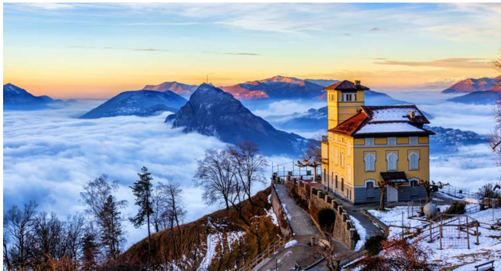
Mystische Stimmung – der Luganer See unter Wolken

Zusätzlich nur vorab buchbar: Ausflug Mailand € 79,-