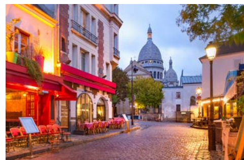
Charmant – Montmartre

Alternativ können Sie an einem zusätzlich buchbaren Ausflug nach Montmartre teilnehmen. Dieser charmante Stadtteil, bekannt für seine künstlerische Atmosphäre, bietet eine Vielzahl an Highlights. So besuchen Sie zunächst die Basilika Sacré-Coeur. Hier erwartet Sie eine Fahrt mit dem sogenannten Petit Train, der Sie durch die malerischen Viertel dieses historischen Bezirks führt. Entdecken Sie die Kunstszene und das besondere Flair von Montmartre, das schon viele Künstler inspiriert hat. Später genießen Sie abschließend ein letztes Abendessen an Bord und lassen Ihre Kreuzfahrt entspannt ausklingen, während Sie die wundervollen Erlebnisse des Tages Revue passieren lassen.