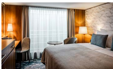
Kabinenbeispiel mit frz. Balkon

französischen Balkon mit bodentiefen Panoramafenster. Die Betten lassen sich auf Wunsch getrennt stellen.