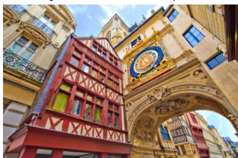
Uhrengasse in Rouen

Um 4.30 Uhr legt das Schiff in Mantes-la-Jolie ab und begibt sich auf den Weg nach Rouen. Genießen Sie ein ausgiebiges Frühstück an Bord, während Sie die wunderschöne Landschaft entlang der Seine vom Wasser aus bewundern können. Nutzen Sie den ruhigen Vormittag auf dem Schiff und entspannen Sie bei einem guten Buch oder netten Gesprächen mit