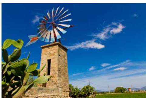
Windmühlen mit Tradition