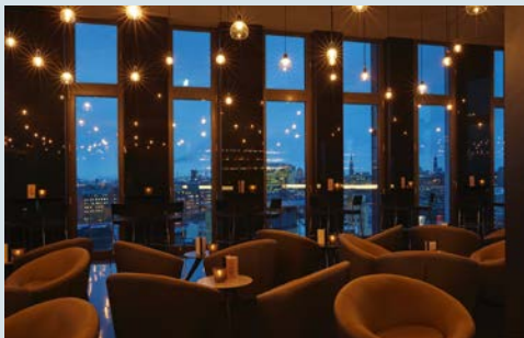
In der Hotelbar