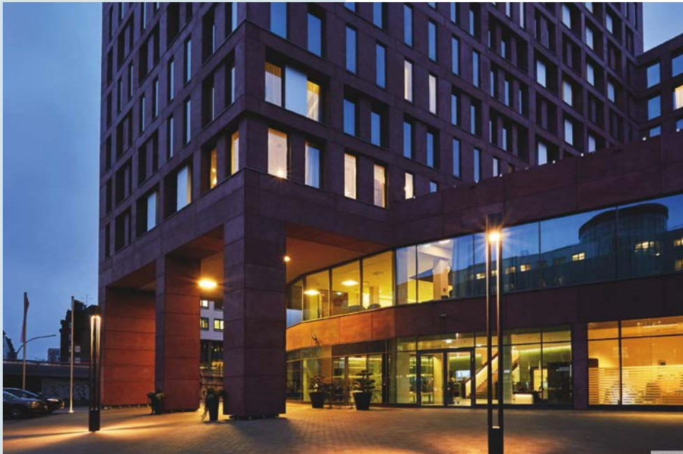
Ihr Hotel Hyperion Hamburg