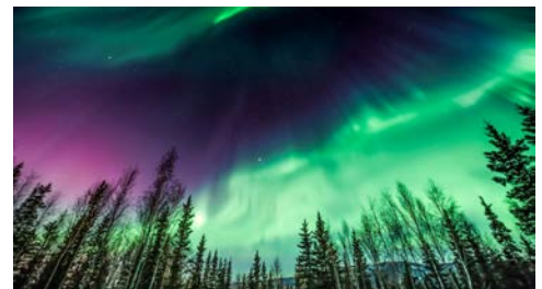
und unendlich viel mehr!

Tierwelt zu beobachten. Am Nachmittag erreichen Sie Whitehorse, die Hauptstadt des Yukon-Territoriums in Kanada. Nur wenige Städte auf der Welt bieten einen so umfassenden Zugang zu unberührter Wildnis und dennoch alle Annehmlichkeiten einer modernen Stadt. Bummeln Sie entlang des Yukon-Rivers und genießen Sie den Blick auf die umliegenden Berge.