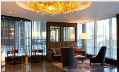
Herzlich willkommen im Hotel Hyatt Regency London

Für die Flüge gilt: Flüge in der Economy Class.