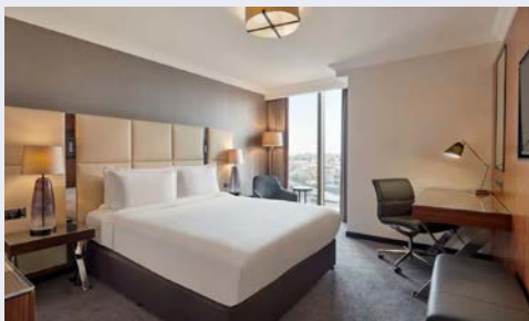
Zimmerbeispiel im Hotel

Die durchdacht gestalteten Standardzimmer verfügen über luxuriöse Badezimmer mit herrlichen Regenduschen und Smart-TVs, mit denen Sie Ihre Lieblingsstreamingdienste streamen können.