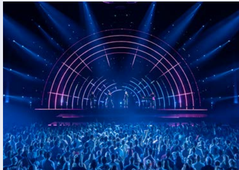
Freuen Sie sich auf ein sensationelles Konzert-Event

Am Abend öffnet die einzigartige ABBA-Arena ihre Türen und lässt Sie in die 70er und 90er Jahre der schwedischen Popband ABBA eintauchen, wenn die Avatare von Agnetha, Björn, Benny und Anni-Frid mit einer zehn-köpfigen Liveband auf der Bühne erscheinen und Sie ein Konzert erleben, bei dem physische und digitale Grenzen verschwimmen werden.