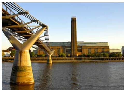
Die „Tate Modern“ an der Themse

of Parliament zum berühmtesten und historisch bedeutendsten Bauwerk Englands, The Westminster Abbey, gelangen. Auf einem geführten Rundgang besichtigen Sie die Krönungskirche der englischen Monarchen und Begräbnisstätte gekrönter Häupter, wie Mary Stuart, sowie berühmter Briten, wie den Wissenschaftler Isaac Newton oder Charles Darwin. 1056 durch Edward The Confessor im normanischen Stil errichtet, erhielt sie 1245 durch Henry III. ihr heutiges Erscheinungsbild im Stil der französischen Gotik. Am Abend besuchen Sie The Shard den höchsten Wolkenkratzer Europas. Sie fahren auf Level 31 und genießen Ihr Abschiedsabendessen mit Aussicht auf die beleuchtete Stadt aus der Vogelperspektive.