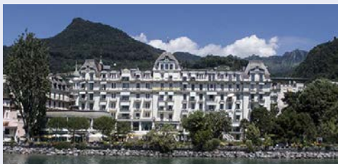
Direkt am Ufer – Eden Palace au Lac

Das Hotel Eden Palace au Lac bietet höchsten Komfort im Herzen der Stadt Montreux, an den Ufern des Genfer Sees. Die luxuriösen Deluxe-Zimmer mit Seeblick verfügen über eine durchschnittliche Fläche von 18 m 2 . Sie sind alle mit einem Badezimmer, einem Haartrockner, einer Minibar, einem Schreibtisch mit Telefon und einem Flachbildfernseher aus- gestattet. In einem herzlichen Ambiente auf der Terrasse mit Blick über den Genfer See genießen Sie werden raffinierte Menüs des Chefs serviert.