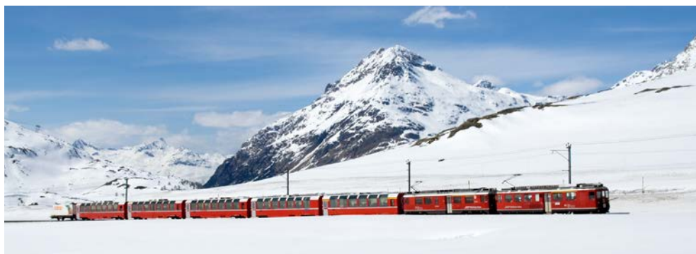
Der Glacier Express

Ausflug Lugano mit Schiffsfahrt/ Stadtführung, Besuch Hermann Hesse Museum € 99,-