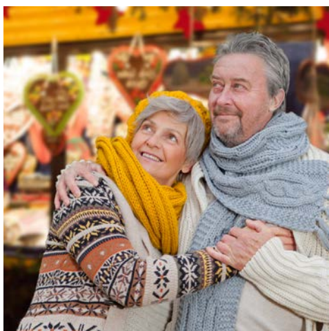
Genießen Sie die Weihnachtstage

Sie genießen noch einmal das reichhaltige Frühstücksbuffet, bevor Sie Ihr Bus gegen 11 Uhr wieder nach Hause zurück bringt.