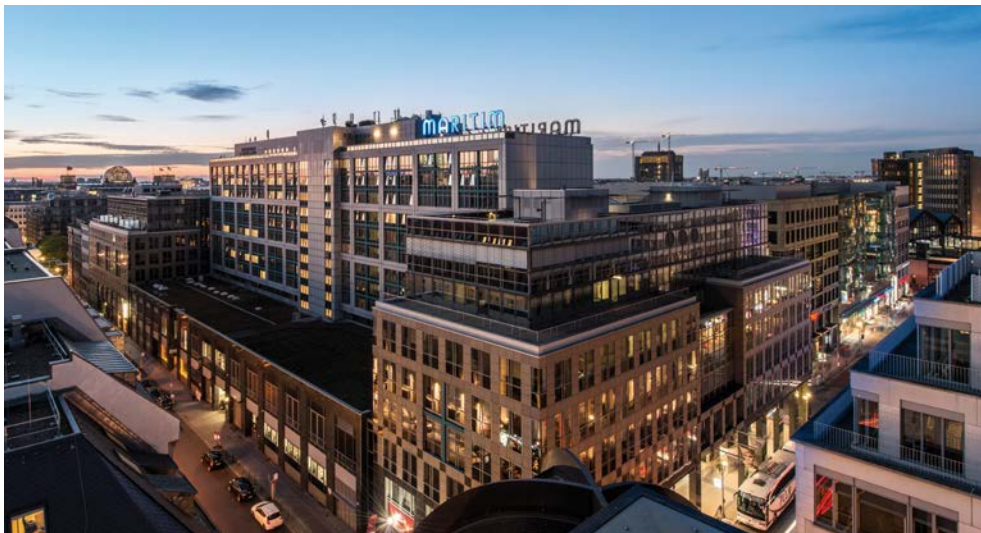
Mitten in Berlin gelegen – Ihr Maritim proArte Hotel