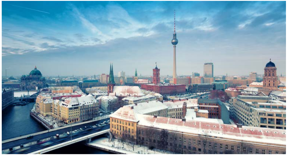
Herzlich willkommen in Berlin

Sie möchten Weihnachten nicht allein zu Hause verbringen, sondern lieber im geselligen Kreis, in festlicher Ambiente und mit einem stilvollen Rahmenprogramm? Begleiten Sie uns über die Feiertage in die festliche geschmückte Hauptstadt. Besonders in der Weihnachtszeit erstrahlt die Stadt im Lichterglanz und die Prachtboulevards Unter den Linden und der Kurfürstendamm werden mit beeindruckenden Installationen illuminiert. Der Ausgangspunkt für Ihre Weihnachtsreise könnte besser nicht gewählt sein, denn Sie wohnen im Maritim proArte Hotel direkt auf der Friedrichstraße. Das Hotel befindet sich fußläufig zu vielen weiteren Sehenswürdigkeiten wie dem Brandenburger Tor, dem Alexanderplatz und dem Berliner Dom. Neben dem Klassikkonzert „Forellenquintett“ von Franz Schubert im Bode-Museum besuchen Sie auch die brandneue Show „FALLING IN LOVE“ im Friedrichstadt-Palast, die erst im September diesen Jahres Premiere feiert.