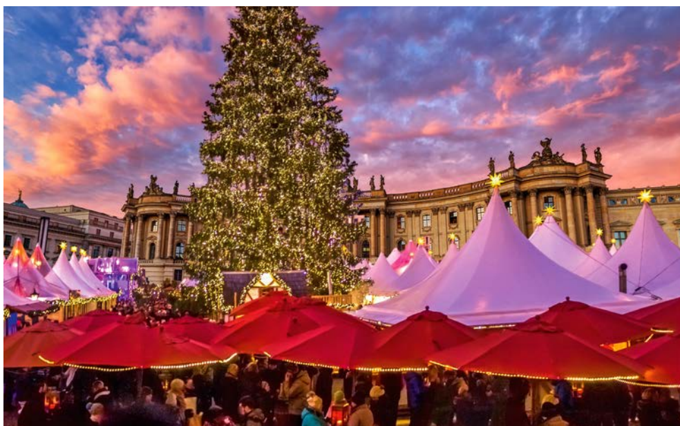
Der stimmungsvolle Weihnachtsmarkt am Bebelplatz