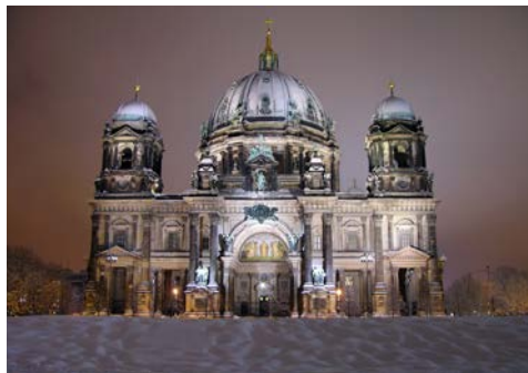
Der Berliner Dom

Zurück im Hotel haben Sie Freizeit bevor Sie am Nachmittag eine weihnachtliche Kaffeetafel mit musikalischer Untermalung und Christstollen unterm Weihnachtsbaum erwartet. Am Abend serviert man Ihnen im Hotel ein festliches Weihnachtsdinner inklusive Getränke. Sie genießen die leckeren Speisen und Getränke und lassen den Heiligabend gesellig ausklingen.