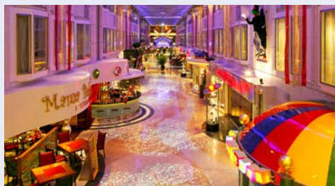
Genießen Sie die Vielfalt an Bord

Die Schiffe der COLOR LINE werden Sie begeistern. Die schwimmenden Hotels bieten Ihnen während Ihrer Kreuzfahrt eine Erlebniswelt der Extraklasse. Das Herz der faszinierenden Schiffe ist die 160 Meter lange Promenade mit Geschäften, Cafés und Restaurants. Besonders beliebt ist die Observation Lounge ganz oben auf Deck 15 – Sie können beim Cocktail das Rundum-Panorama über die Ostsee oder den Oslo-Fjord genießen! Allabendlich heißt es „It's show time“ im großen Theater (Tischreservierung gegen Gebühr),