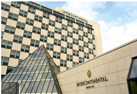
Das InterContinental® Berlin Hotel

Das gehobene InterContinental® Berlin Hotel liegt neben dem grünen Tiergarten, einen Spaziergang vom berühmten Brandenburger Tor entfernt. Schwimmen Sie im einladenden Innenpool und gönnen Sie sich eine Behandlung im SPA InterContinental. Schlürfen Sie einen Cocktail in der Marlene Bar und erleben Sie Gourmetgerichte in einem schicken Restaurant im 14. Stock mit Panoramablick auf die Stadt. Die hellen Classic-Zimmer verfügen über komfortable Möbel, kostenloses WIFI und einen separaten Sitzbereich, wo Sie einen frischen Kaffee zubereiten können.