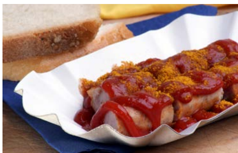
Die typische Berliner Currywurst – lecker!

Sie lassen den Tag entspannt beginnen und genießen noch einmal das reichhaltige Frühstücksbuffet Ihres Luxus-Hotels. Ihr Zimmer steht Ihnen bis 11 Uhr zur Verfügung. Mit dem Transfer zum Bahnhof und der Heimfahrt endet diese, in vielerlei Hinsicht einzigartige Kulturreise, zu Ende.