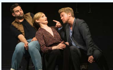
„Die Stachelschweine“, Szenefoto