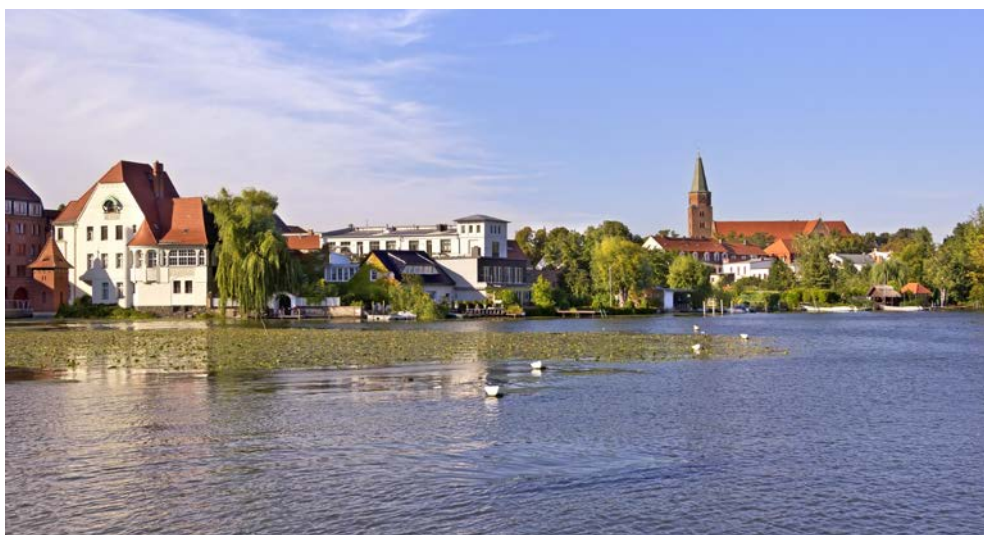
7-Seen-Schiffsfahrt auf den Havelseen