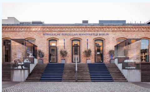
Die Königliche Porzellan Manufaktur