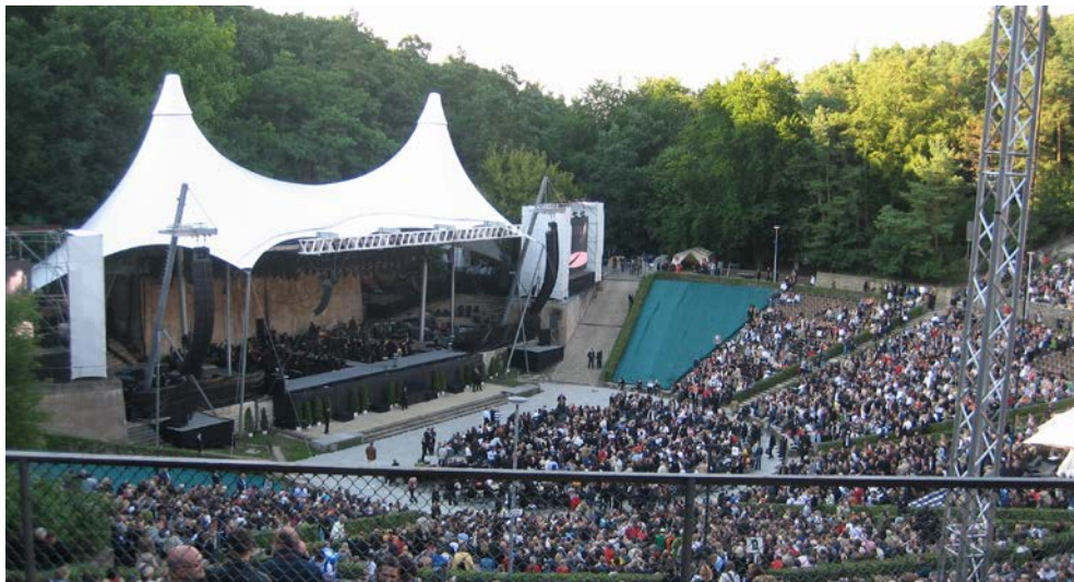
Die Berliner Waldbühne