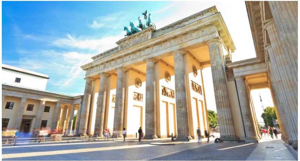
Das Brandenburger Tor

Erleben Sie ein ganz besonderes Konzerthighlight auf der Waldbühne in Berlin. Das West-Eastern Divan Orchestra unter der Leitung von Star-Dirigent Daniel Barenboim wurde 1999 gegründet und besteht zu gleichen Teilen aus israelischen und arabischen Musikern. Gemeinsam steht das Symphonieorchester für friedliche Lösungen im Nahostkonflikt. An diesem Abend wird das Orchester begleitet von Martha Argerich. Sie gilt als eine der größten Pianistinnen unserer Zeit und wird in einem Atemzug mit legendären Namen wie Benedetti Michelangeli, Horowitz und Pollini genannt. Erleben Sie dieses stimmungsvolle Konzert im besonderen Ambiente der Waldbühne. Dazu erwartet Sie ein sommerliches Rahmenprogramm in der Hauptstadt mit vielen besonderen Highlights.