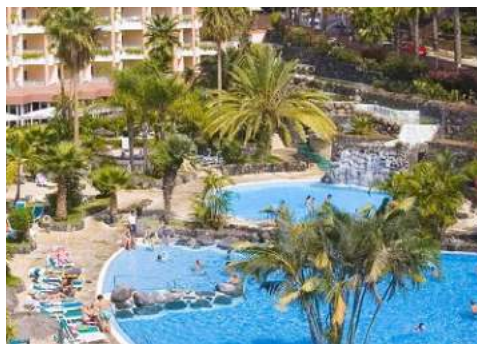
Blick von Ihrem Hotel auf den Pool

Das 4-Sterne Hotel Puerto Palace befindet sich in Puerto de la Cruz im Norden Teneriffas. Von Ihrem Hotel haben Sie einen herrlichem Blick auf das Orotava-Tal, den Teide und den Atlantik. Restaurants, Einkaufs- und Freizeitmöglichkeiten sind in direkter Nähe. Das gemütliche und familiäre Hotel ist seit zwei Generationen unter deutscher Leitung und bietet Ihnen das perfekte Ambiente für Ihren Aufenthalt auf Teneriffa. Die charmant eingerichteten Zimmer verfügen über einen Balkon und einen Minikühlschrank.