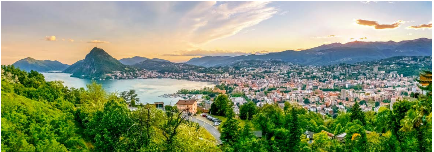
Der Luganer See

schönsten Botanischen Gärten der Laghi und präsentiert sich zu jeder Jahreszeit, auf einer Fläche von 16 ha, von seiner besten Seite. Im Frühjahr bezaubert er mit über 500 verschiedene Rhododendron-Arten und einem Blütenmeer von über 80.000 Tulpen in verschiedenen Farben. Flanieren Sie durch den Park, vorbei an alten Buchen und an einer Fülle von exotischen Pflanzen. Nach einer Mittagspause in Intra kehren Sie nach Stresa zurück, wo Ihnen bis zum gemeinsamen Abendessen die Zeit zur freien Verfügung steht.