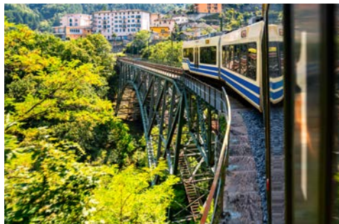
Die Centovalli Bahn

Ihr heutiger Ausflug führt Sie ins Sopraceneri des Schweizer Kantons Tessin. Per Bus geht es nach Domodossola, von wo Sie weiter mit der Centovalli