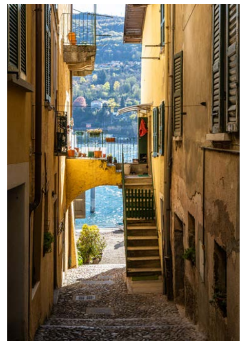
Schmale Gasse in Stresa