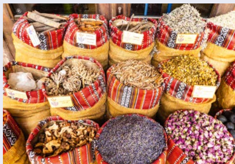
Gewürze in den Souks