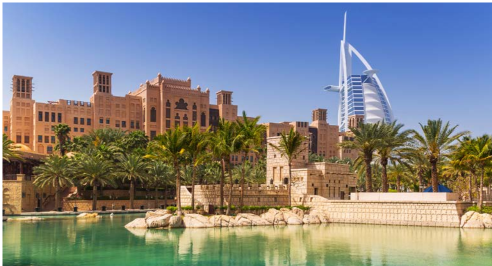
Dubai – Tradition und Moderne