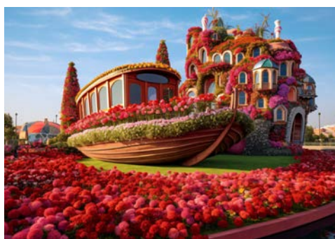
Faszinierend: Der Dubai Miracle Garden

In Dubai gibt es so viel zu entdecken. Das höchste Gebäude der Welt, der Burj Khalifa, bietet Licht- und Wasserspiele der besonderen Art. Setzen Sie sich in ein Café in der Nähe und genießen Sie das Schauspiel. Die Sheikh Zayed Road mit ihren Wolkenkratzern, sowie die größte Einkaufsmeile der Welt, die Dubai Mall sind ebenfalls einen Besuch wert.