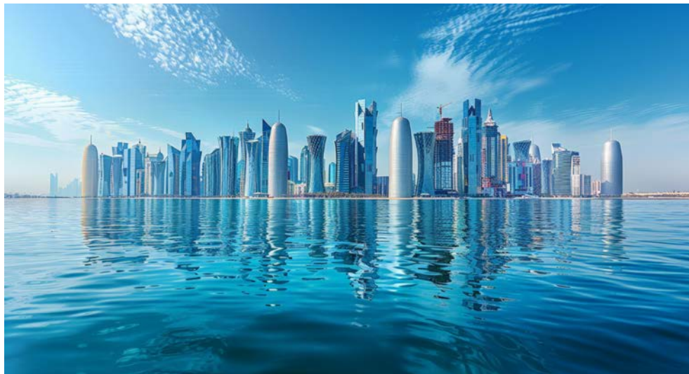
Die Skyline von Doha