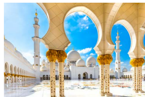
Die Sheikh Zayed Moschee in Abu Dhabi

Am frühen Morgen erfolgt der Transfer zum Flughafen und der Flug nach Dubai. In Dubai angekommen unternehmen Sie eine Panoramafahrt. Sie werden staunen: Unfassbar hohe Gebäude, Hotels mit sieben Sternen und die teuersten Autos der Welt – ganz klar, Dubai ist als Ort der Superlative bekannt. Bei all dem Überfluss gerät die Vergangenheit schnell in Vergessenheit. Vollkommen zu unrecht, denn die ist besonders schön. Transfer zum Hafen und Einschiffung auf die Mein Schiff 4 . Der 2. Teil Ihrer Reise beginnt!