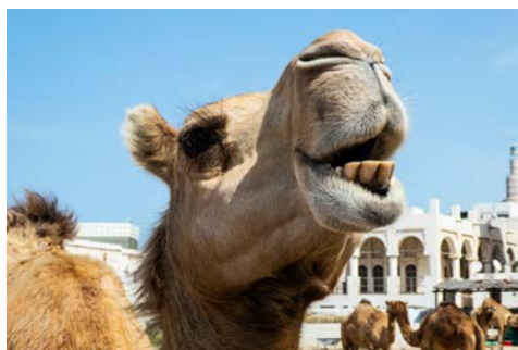
Auf dem Kamelmarkt in Doha

Ihre Reise beginnt mit dem Flug nach Doha. Am Flughafen werden Sie von Ihrer örtlichen, Deutsch sprechenden Reiseleitung empfangen und zu Ihrem Hotel begleitet. Übernachtung.