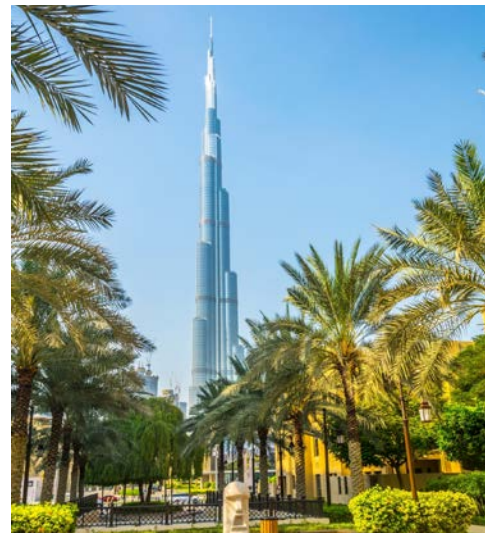
Das höchste Gebäude der Welt: der Burj Khalifa mit 828 m