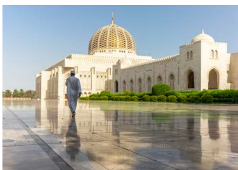
Die Große Moschee in Maskat

nicht gespart: Die Sheikh Zayed Moschee ist das weltweit drittgrößte islamische Gotteshaus – mit der größten Moscheekuppel überhaupt. Sie ist über 70 m hoch und spannt sich über 32 m.