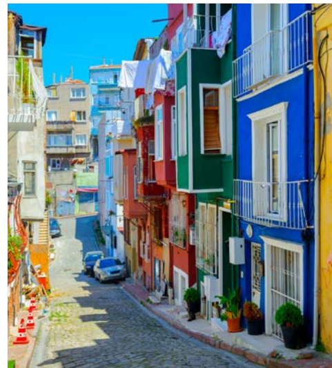
Auch das ist Istanbul – bunte Fassaden in der Altstadt