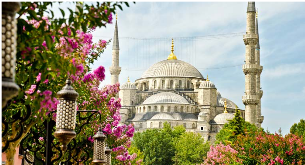
Die Blaue Moschee