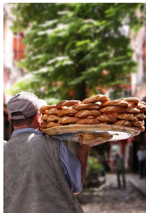
In der Altstadt