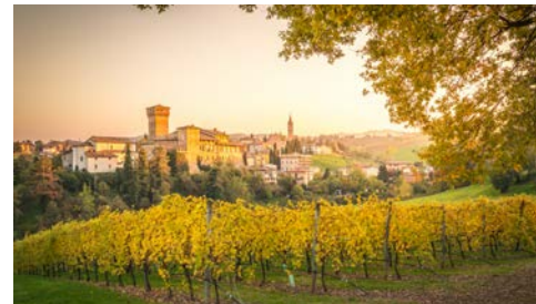
Herrliche Landschaft rund um Modena