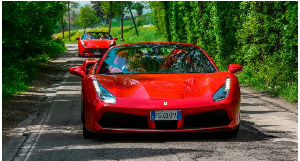
Setzen Sie sich selbst ans Steuer!