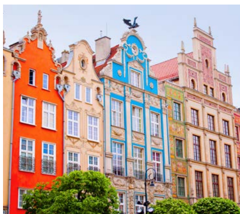
Typisch Danzig, bunte Altstadtfassaden überall

In Danzig werden Sie von Ihrer örtlichen, Deutsch sprechenden Reiseleitung empfangen und zum Hotel begleitet. Am Nachmittag erkunden Sie die Danziger Altstadt auf einem Stadtrundgang. Sie besuchen u.a. den Langen Markt, auch Salon von Gdansk genannt und die Marienkirche, die als größte Kirche Polens gilt. Ihr 79 Meter hoher Turm ist ein ausgezeichnete Aussichtspunkt, und in der Kirche selbst können Sie viele Kulturschätze, Gemälde und Altare bewundern. Außerdem sehen Sie das Goldene Tor und die Grüne Pforte sowie das beeindruckende historische Krantor. Den Abend beschließen Sie in einem direkt am Hafen gelegenen Altstadtrestaurant, in welchem Sie zu Abend essen. Genießen Sie die polnische Küche und ihre traditionellen Gerichte und kosten Sie das typische Danziger Goldwasser. Bei einem kleinen Verdauungsspaziergang erreichen Sie Ihr fußläufig gelegenes Hotel zur Übernachtung.