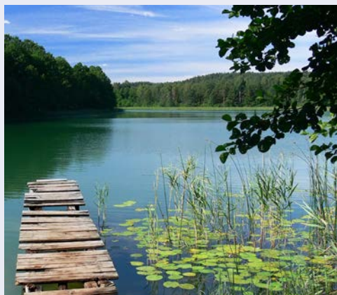
Hügel und Seen in der Kaschubischen Schweiz