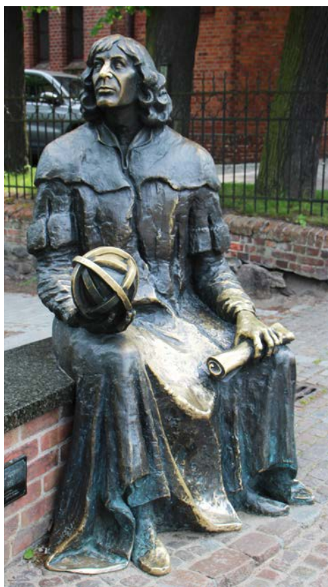
In Frauenburg dreht sich alles um Kopernikus

Nach dem Frühstück im Hotel erfolgt die Rückreise.