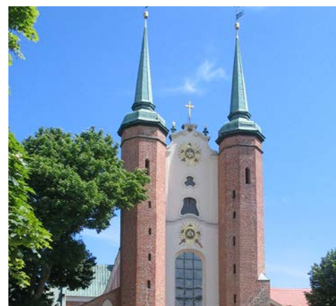
Die markanten Türme der Kathedrale in Danzig-Oliwa

Nach dem Frühstück erfolgt die Busfahrt zum Stadtteil Oliwa. Hier besichtigen Sie die heutige Kathedrale, die Zisterzienserkirche und lauschen einem Orgelkonzert auf der berühmten Barockorgel. Sehenswert sind darüber hinaus der Abtpalast und das Diözesanmuseum. Weiter geht die Fahrt nach Zoppot, die lebendige Stadt an der Ostsee ist besonders bei Künstlern beliebt. Es erfolgt ein Spaziergang durch die schöne Monte Casino Straße bis zur längsten Holzmoles Europas (512 m).