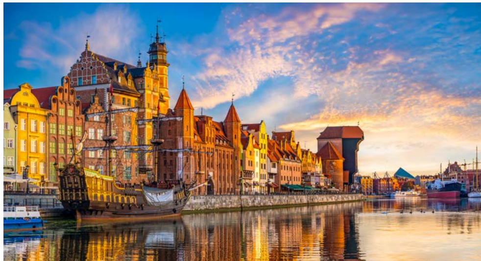
Das Krantor am Hafen der Hansestadt Danzig