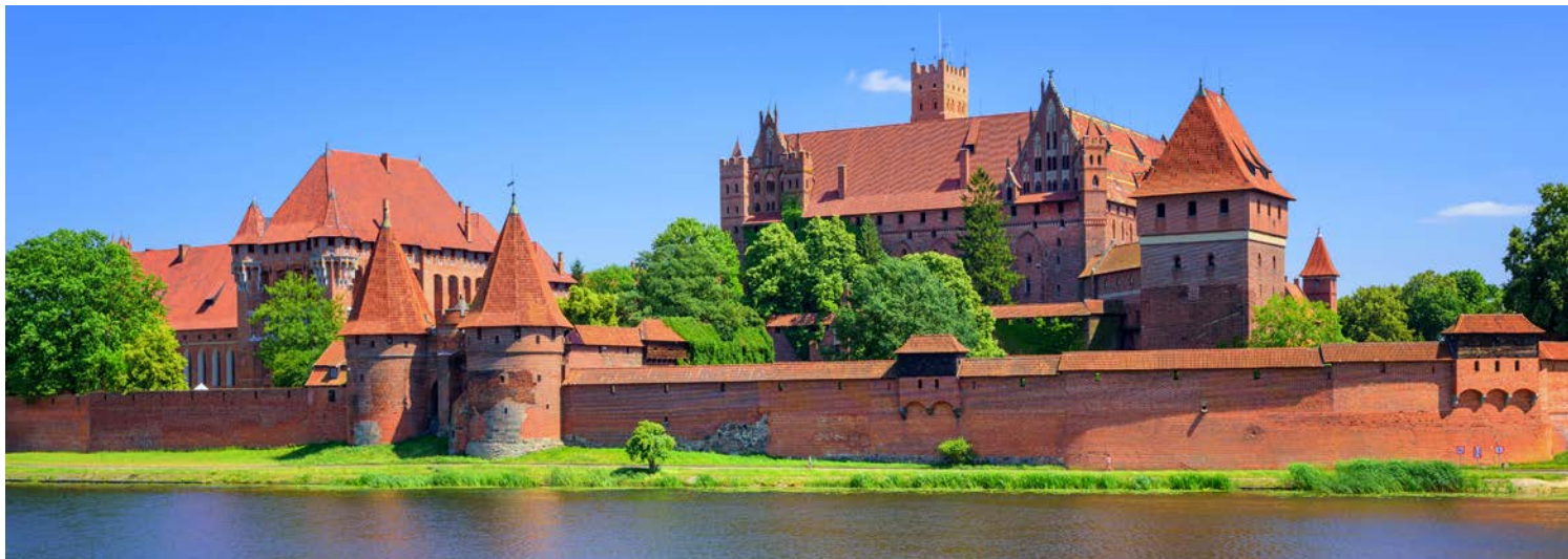
Besichtigen Sie den größten Backsteinbau der Welt, die Marienburg!

Burggemächern der Hochburg gehören der Kapitelsaal, die Schatzkammer, drei Kapellen und die Schlafkammern. Die im 13. Jh. erbaute Hochburg erreicht man über die Zugbrücke. In der Mitte des Innenhofs befindet sich ein 18 m tiefer Brunnen, der während der Belagerung genutzt wurde. In den Wehrmauern ist das Burgmuseum untergebracht mit Sammlungen zur Geschichte der Burg, mittelalterlichen Skulpturen und Keramik. Die Kunstabteilung verfügt über wertvolle Exponate des Kunsthandwerks.