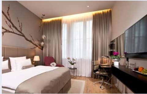
Zimmerbeispiel im Hotel