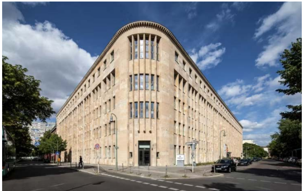
Crowne Plaza® Berlin – Potsdamer Platz