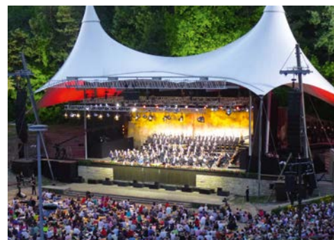
Sie erleben die Philharmoniker in der Waldbühne!