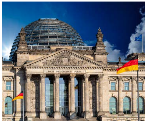
Reichstag – ein Stück deutsche Geschichte