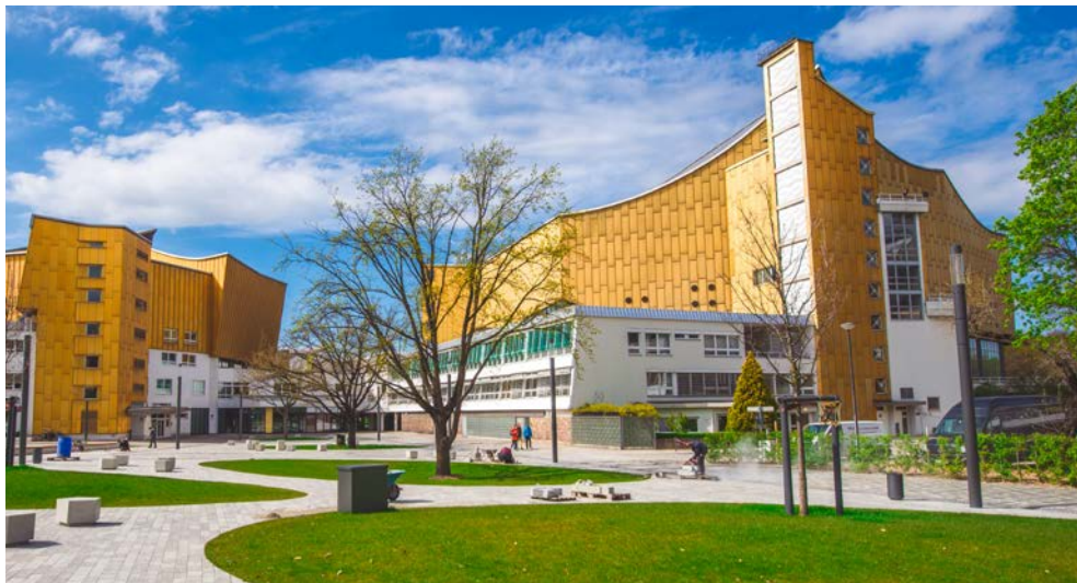
Philharmonie – Freuen Sie sich auf eine Führung durch das berühmte Konzerthaus