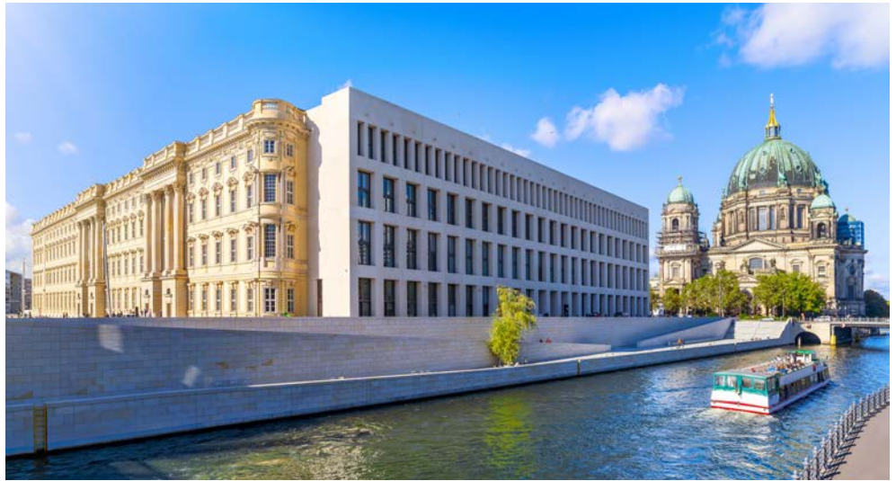
Freuen Sie sich auf eine sommerliche Schiffsfahrt und auf den Ausblick vom Humboldt Forum

Sie wohnen im First Class Hotel Crowne Plaza Berlin – Potsdamer Platz.