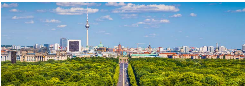
Skyline von Berlin