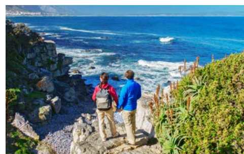
Die Küstenwanderung von Hermanus