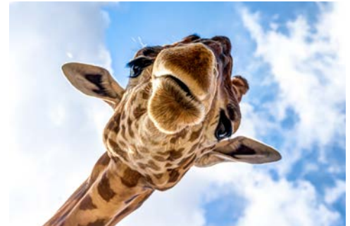
Giraffen heißen Sie willkommen

seltsam gebildete Gesteinsformation sind die Bourke's Luck Potholes. Vom „God's Window“ haben Sie dann einen herrlichen Blick über Mpumalanga. Am späten Nachmittag Ankunft in Ihrer Lodge. (F, A)