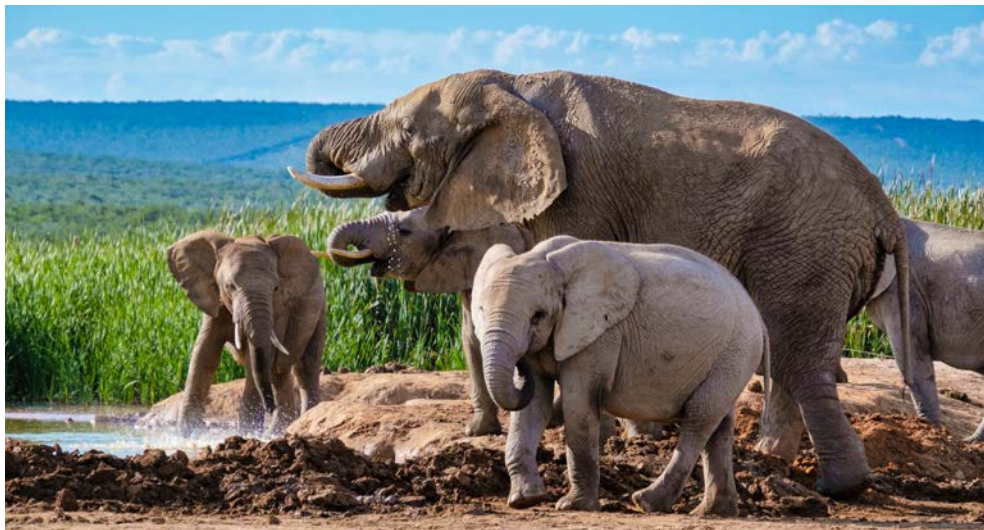
Spannende Pirschfahrt – Augen auf und Kamera raus!