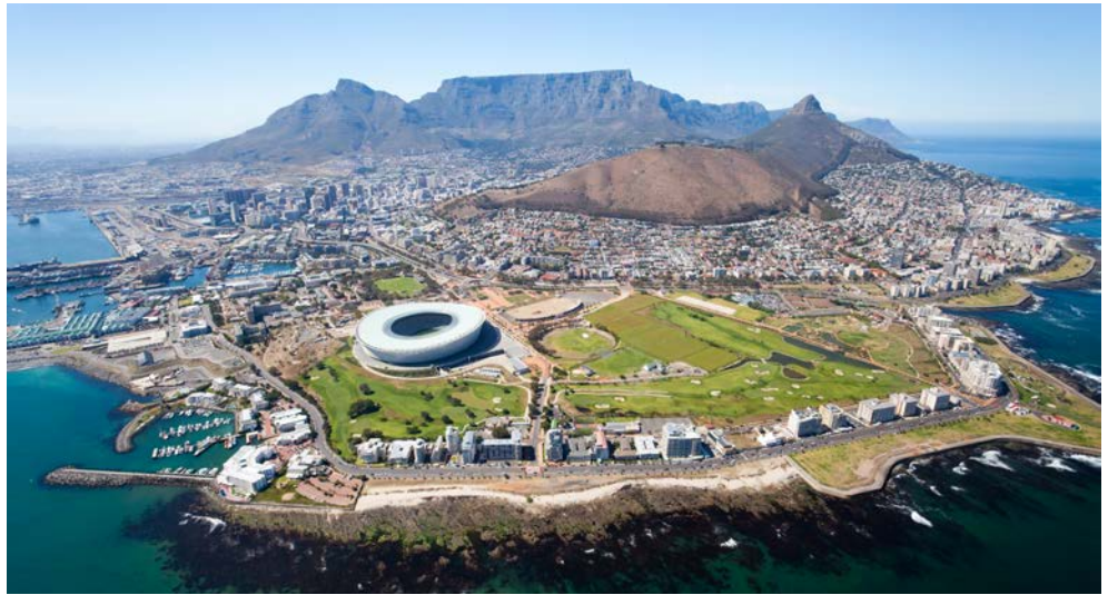
Kapstadt – spektakulär!