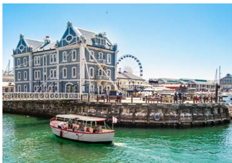
V & A Waterfront

Am Vormittag unternehmen Sie eine Rundfahrt durch Kapstadt. Bei gutem Wetter fahren Sie mit der Seilbahn auf den Tafelberg und haben einen herrlichen Blick auf die Stadt und die Kaphalbinsel. Die Rundfahrt endet mit dem Besuch der Victoria & Alfred Waterfront. Der Nachmittag steht Ihnen in Kapstadt zur freien Verfügung. (F)