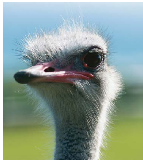
Freuen Sie sich auf den Besuch einer Straußenfarm

Vor den Toren von Kapstadt liegt das Weinanbaugebiet. Der historische Ort Stellenbosch im Zentrum des Weinlandes gefällt vor allem durch seine kapholländischen Bauten. Besuchenswert sind die vielen Museen und die romantische Dorpsstraat. Sie fahren zu einem der schönsten Weingüter, essen dort zu Mittag und probieren auch verschiedene Kapweine. Die Tour endet am Flughafen. Rückflug nach Deutschland. (F, M) Ankunft am 15. Tag.