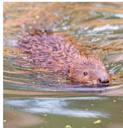
Mit etwas Glück entdecken Sie Biber

Im Schiffshebewerk Niederfinow überwindet die THURGAU CHOPIN einen Höhenunterschied von 36 m. Geniessen Sie die atemberaubende Weitsicht über das Odertal in den frühen Morgenstunden. Während der Fahrt auf der Alten Oder können Sie mit etwas Glück Biber entlang des Flussufers beobachten. Entspannen Sie sich an Bord und lassen Sie die unberührte Natur an sich vorbeigleiten. Am Nachmittag Ankunft in Stettin.