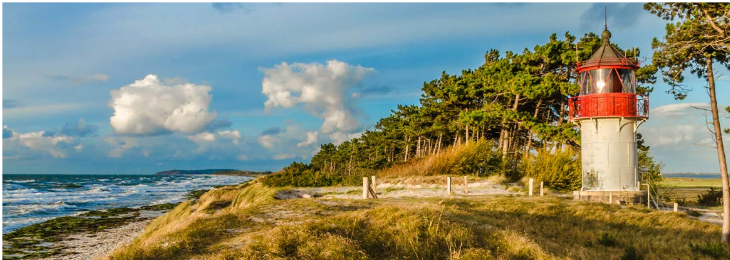
Willkommen auf Hiddensee

Ausflugspaketes gebuchten Rundgang durch die Altstadt von Greifswald erfahren Sie alles Wissenswerte über die Geschichte der Hansestadt.