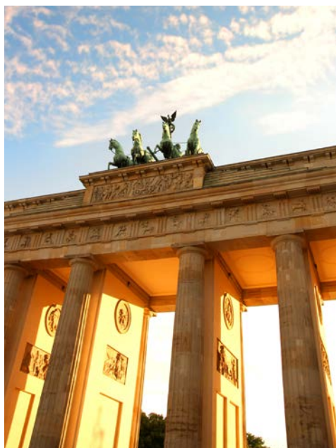
Brandenburger Tor – Berlin

Am Vormittag haben Sie noch die Möglichkeit die pulsierende Hauptstadt Deutschlands zu erkunden. Am Mittag heisst es «Leinen los!» Nachmittags Schiffsfahrt auf Tegeler See, Havel und Oder-Havel-Kanal.