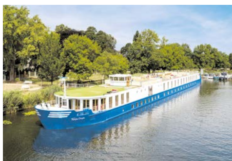
Willkommen an Bord der THURGAU CHOPIN

Einige Stopps dienen nur der Ausflugsabwicklung