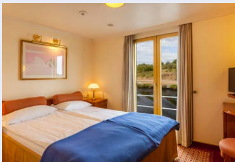
Kabinenbeispiel – Oberdeck

Programmänderungen vorbehalten. An- und Abreisegut dienen ausschließlich der Erbringung der vertraglichen Beförderungsleistungen. Stand 02/24 – alle Angaben ohne Gewähr.