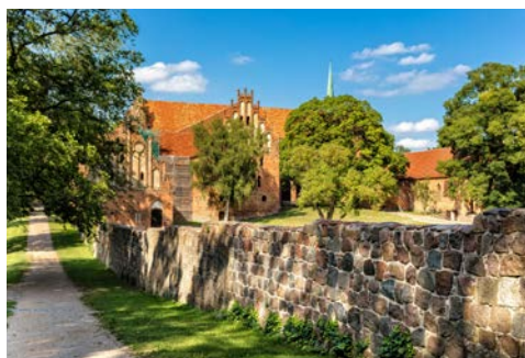
Kloster Chorin in Eberswalde

Ausschiffung nach dem Frühstück und individuelle Heimreise.