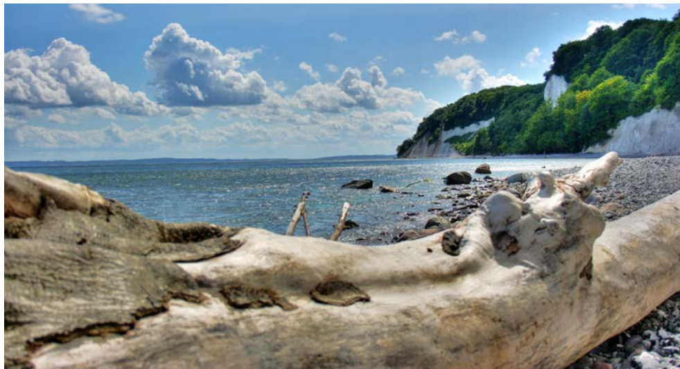
Blick auf die Kreidefelsen auf Rügen

Freuen Sie sich auf eine traumhafte Flussreise mit der THURGAU CHOPIN zu den charmanten Ostseeinseln Rügen, Usedom, Wollin und Hiddensee. Ihre Reise startet in der pulsierenden Hauptstadt Berlin, von dort aus geht es Richtung Niederfinow. Im Schiffshebewerk überwindet die THURGAU CHOPIN einen Höhenunterschied von 36 m. Geniessen Sie die atemberaubende Weitsicht über das Odertal. Mit etwas Glück beobachten Sie Biber entlang des Ufers. Entspannen Sie sich an Bord und lassen Sie die unberührte Natur an sich vorbeigleiten. Von Stettin über die Insel Wollin und Wolgast gelangen Sie zur bezaubernden Sonneninsel Usedom mit ihren mondänen Seebädern Koserow und Zinnowitz. Ein Highlight jagt das Nächste: die markanten Kreidefelsen auf Rügen, der Nationalpark „Vorpommersche Boddenlandschaft“, das autofreie Hiddensee und die historische Altstadt von Stralsund werden Sie begeistern. Ihre wunderbare Reise über Deutschlands schönste Sonnenroute endet mit sicherlich großartigen Eindrücken wieder in Berlin.