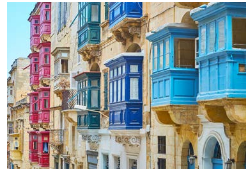
Bunte Fassaden in der Altstadt von Valletta

Sehenswürdigkeiten, die St. John's Co-Kathedrale. Die Marmorgrabmäler zeugen von Macht und Reichtum der Ritter und im Oratorium befindet sich das wertvollste Gemälde der Insel, die „Enthauptung Johannes des Täufers“ des italienischen Meisters Caravaggio.