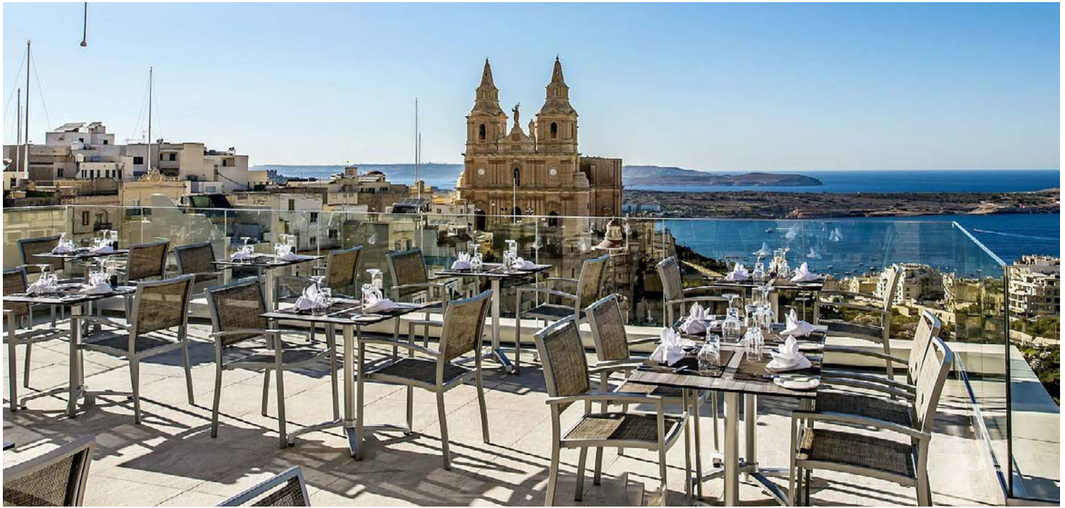
Genießen Sie den Blick von der Dachterrasse