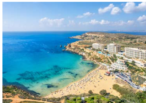
Golden Bay Beach

Als erstes besuchen Sie die beeindruckende Ggantija Tempelanlage (UNESCO Weltkulturerbe). Sie gilt als eines der ältesten freistehenden Bauwerke der Welt, entstand vor mehr als 5.000 Jahren und bietet im Museum alle wissenswerten Informationen. Die hübsche Inselhauptstadt Victoria, mit der auf einem Hügel thronenden mächtigen Zitadelle, der im 17. Jh. entworfenen Kathedrale und zahlreichen Museen, ist Ihr nächstes Ziel. Von hier oben haben Sie einen wundervollen Rundblick über weite Teile der Insel. In Xlendi, zauberhaft gelegen an einer verträumten Bucht, mit kleiner Promenade und einem treppenreichen Pfad zu einer kleinen Höhle, machen Sie eine Pause und genießen einen mediterranen Mittagssnack. Zum Abschluss geht es zum Fungus Rock und der Felsenküste von Dwejra, wo sich das „Blaue Fenster“ befand, das vor ein paar Jahren auf natürliche Weise im Meer versank, und wo sich der Binnensee befindet, der zu einer Bootsfahrt einlädt (Fahrt wetterbedingt und nicht im Preis enthalten).