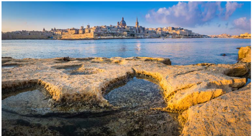
Blick auf Valletta

Der Tag beginnt mit einer Fahrt zur Blauen Grotte. Diese außergewöhnliche Naturschönheit mit ihrem kristallklaren Wasser kann vom Boot aus besichtigt werden (wetterabhängig und nicht im Preis inkludiert). Von dort geht es weiter zum vielleicht schönsten Megalith-Tempel Malts: Hagar Qim, wörtlich übersetzt, die stehenden Steine. Monumental und beeindruckend liegt die steinzeitliche Tempelanlage in der Nähe des Dorfes Qrendi, in einsamer Natur, an der Südküste der Hauptinsel gelegen. Ein wirklich gut erhaltenes Bauwerk mit Orakelnische und Altären und dem größten in Malta verbauten Stein mit einem Gewicht von 60 Tonnen. Neben Einblicken in prähistorische Kultur sollten allerdings auch die Ausblicke nicht fehlen. Marsaxlokk, ein wunderschönes Fischerdorf, malerisch, lebendig und mit typischen maltesischen Fischerbooten geschmückt, wird Sie begeistern.