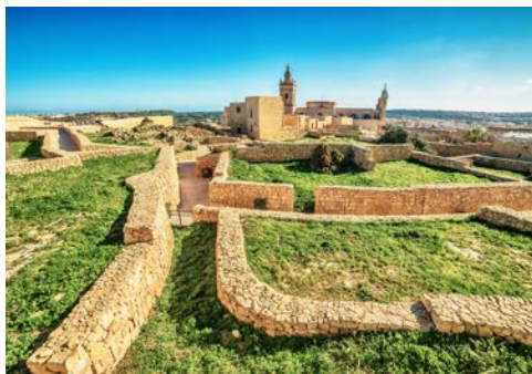
Zitadelle in Victoria auf Gozo

Als nächstes stehen die Dingli Klippen auf dem Programm – dem höchstgelegenen Punkt der Insel, ein landschaftliches Highlight im Südwesten, steil abfallend, ein beeindruckender Anblick mit atemberaubendem Ausblick. Eine natürliche Festung, eine Bastion, die die Ritter gar nicht erst bauen mussten. Dann wartet eine Weinprobe bei Meridiana auf Sie, eines der kleineren Weingüter Maltas und dennoch mit einem Top-Winzer mit sorgfältig ausgewählten hochwertigen Weinen. Nach einer Einführung und einem kurzen Überblick zu den Weinen wird die Verarbeitung der Trauben erläutert und sie kommen in den Genuss von vier Premiumweinen während einer unterhaltsamen Weinprobe. Hierzu werden Käsehäppchen und Galletti gereicht (typische maltesische Cracker). Nach einem langen Tag voller Eindrücke ist eine Weinprobe genau das Richtige, um diesen Tag abzurunden.